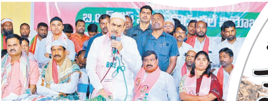
కోస్లి పట్టణంలో నిర్వహించిన ఆత్మీయ సమ్మేళనంలో మాట్లాడుతున్న మంత్రి మహమూద్ అలీ, చిత్రంలో మంత్రి పట్నం మహేందర్ రెడ్డి, కొడంగల్ ఎమ్మెల్యే పట్నం నరేందర్ రెడ్డి