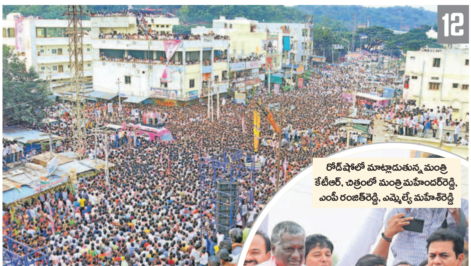
కులకచర్లలో మంత్రి కేటీఆర్ రోడ్ షోకు హాజరైన జనం