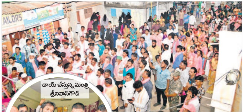
చాయ్ చేస్తున్న మంత్రి శ్రీనివాస్ గౌడ్