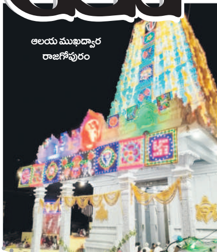
ఆలయ ముఖద్వార రాజగోపురం

మాసాపేట(చిన్నచింతకుంట) నవంబర్ 13 : పేదల తిరుపతి.. కొలిచిన వారికి కొంగు బంగారంగా నిలుస్తున్న కురుమూర్తి స్వామి బ్రహ్మోత్సవాలకు ఉమ్మడి పాలమూరు జిల్లాలో అత్యంత ప్రాధాన్యత కలిగి ఉంది. స్వామి వారి జాతర, ఉద్దాలోత్సవం ఉంటేనే దేశంలో ఎక్కడ ఉన్నా స్వామి వారి ఉద్దాల ఉత్సవాలకు తప్పనిసరిగా వస్తారు. ఉద్దాలోత్సవానికి భక్తులు కుటుంబ సమేతంగా బండ్లు, వాహనాలపై లక్షల్లో తరలివస్తారు. కుటుంబ సమేతంగా స్వామి వారిని కొలిచి, రాత్రి మొత్తం అక్కడే ఉండి స్వామి సన్నిధిలో నిద్ర చేస్తారు. ఈ సంవత్సరం ఒక వైపు ఎన్నికలు, మరో వైపు జాతర ఉండడంతో భక్తుల సందర్భం అధికంగా ఉండనున్నది. ఉత్సవాలకు పాలకవర్గ సభ్యులు, అధికారులు ఏర్పాట్లు చేస్తున్నారు. బ్రహ్మోత్సవ వాల్లో కీలక ఘట్టమైన 14వ తేదీన స్వామి వారి కల్యాణోత్సవంతో బ్రహ్మోత్సవాలు ప్రారంభమవుతాయి. 18వ తేదీన స్వామి వారి అలంకరణోత్సవం, 19న స్వామి ఉద్దాల ఉత్సవం ఉంటుంది.