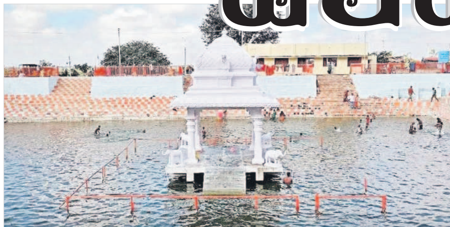
కురుమూర్తి ఆలయ ఆవరణలో కోనేరు