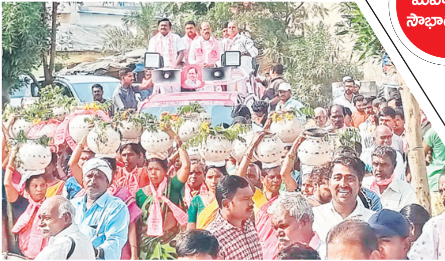
మల్లాపూర్ లో ప్రచారం నిర్వహిస్తున్న ఎమ్మెల్యే బాజరెడ్డి గోవర్ధన్