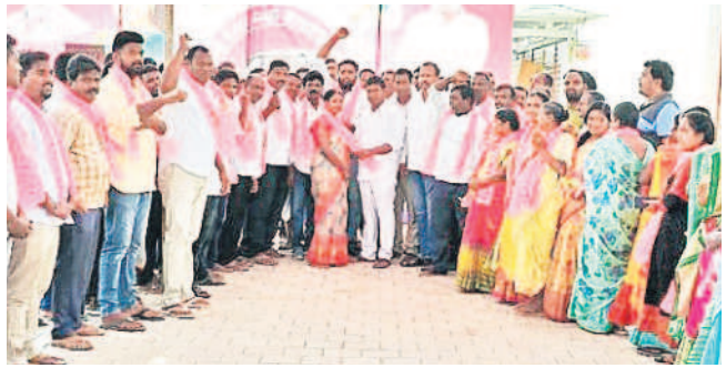
పార్టీలో చేరుతున్న వారికి గులాబీ కండువలు కప్పిస్తున్న ఎమ్మెల్యే జీవన్ రెడ్డి