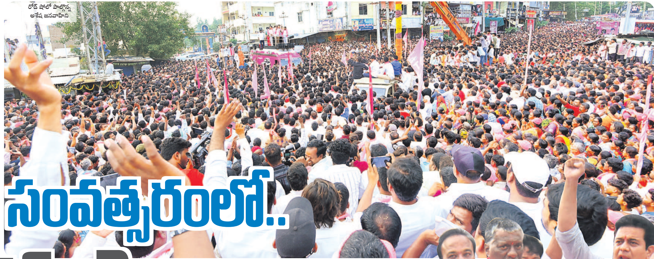
రోడ్ షోలో పాల్గొన్న అశ్వ జనవాహినీ