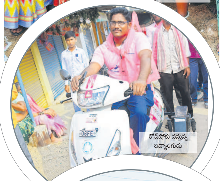
రోడ్ షోకు వస్తున్న దివ్యాంగుడు