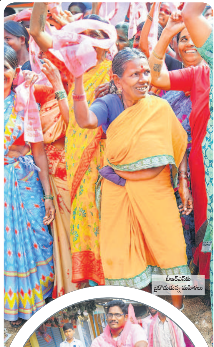
బీఆర్ఎస్ కు జైకొడుతున్న మహిళలు