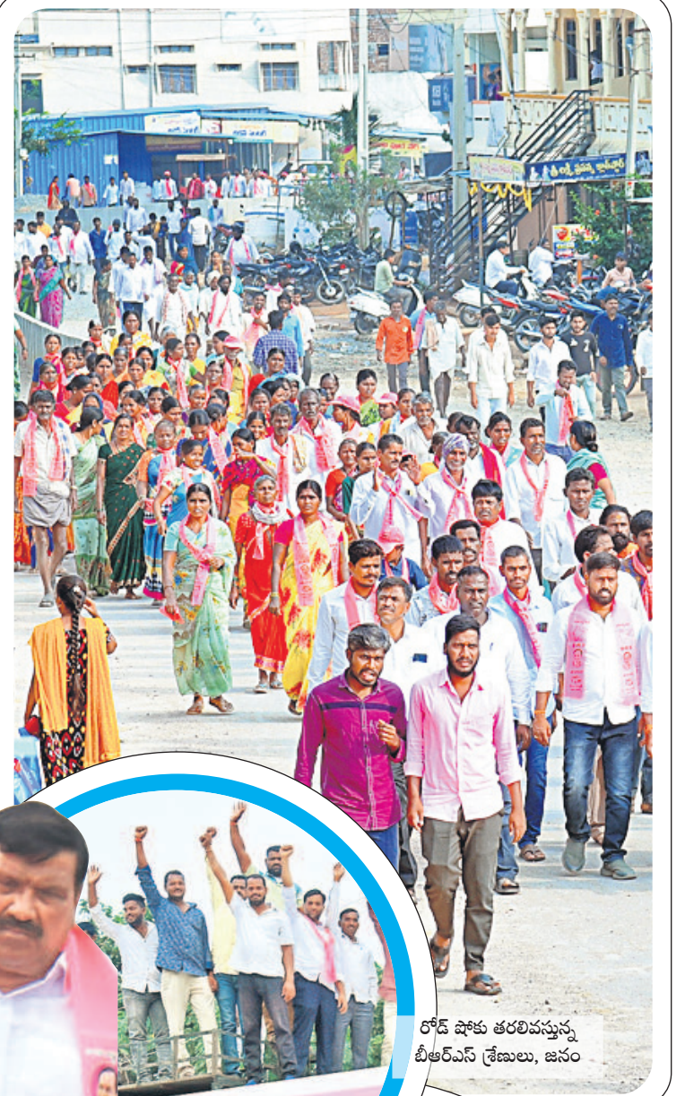
రోడ్ షోకు తరలివస్తున్న బీఆర్ఎస్ శ్రేణులు, జనం