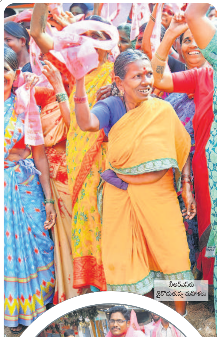
బీఆర్ఎస్ కు జైకొడుతున్న మహిళలు