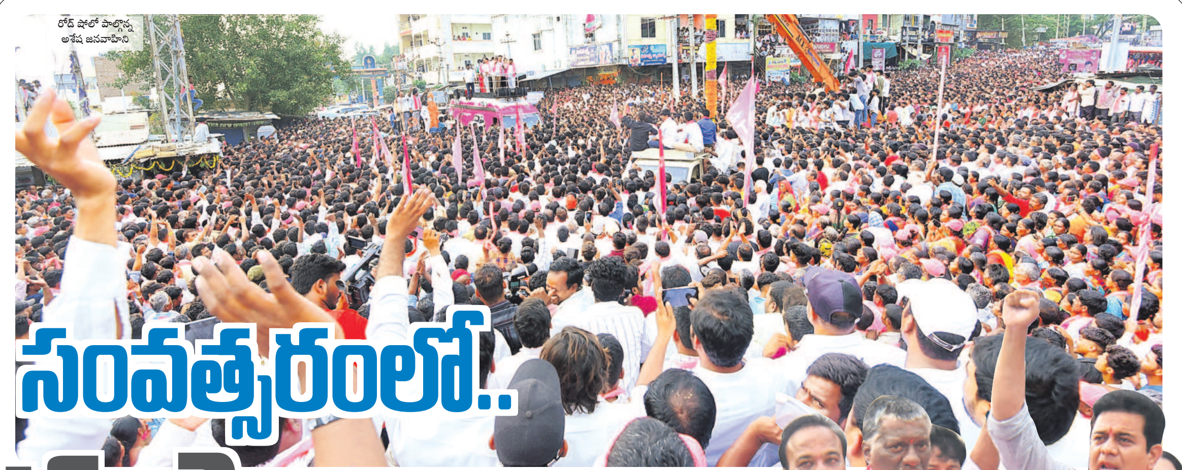
రోడ్ షోలో పాల్గొన్న అశ్వజి జనవాహినీ