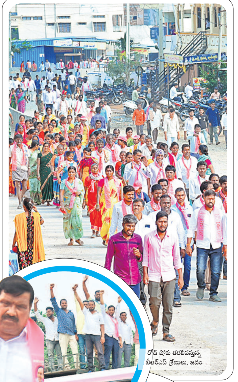
రోడ్ షోకు తరలివస్తున్న బీఆర్ఎస్ శ్రేణులు, జనం