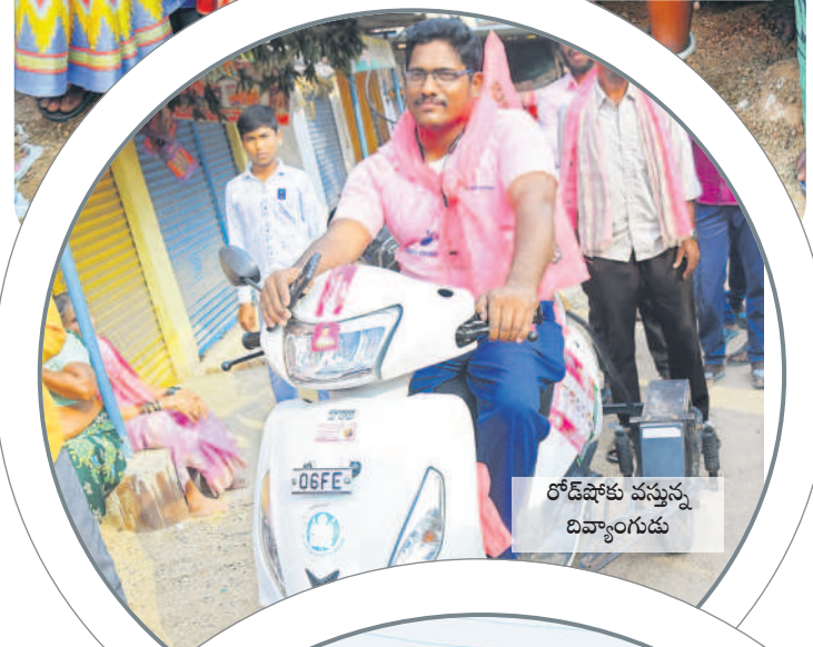
రోడ్ షోకు వస్తున్న దివ్యాంగుడు