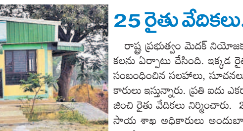
మెదక్ రైతు వేదిక

హవేళీఘనపూర్ మండలం శాలిపేట నుంచి హోవారు డ్యాం వరకు పూర్తయ్యాయి. హవేళీఘనపూర్ మండలం శాలిపేట, బీబీపూర్, ముత్తాయికోట, సర్దన, ఫరీద్పూర్, జక్కన్నపేట, పోచమ్మరాల్ వరకు నీళ్లు అందుతున్నాయి.