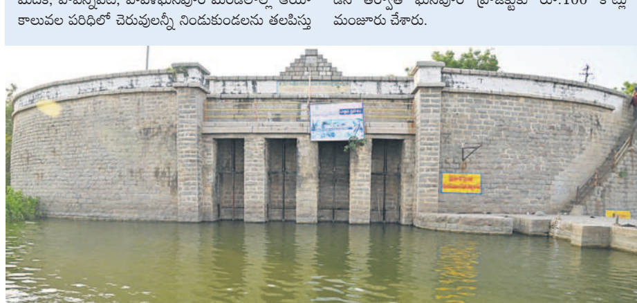
పాపన్నపేట మండల పరిధిలోని ఘనపూర్ ప్రాజెక్టు

ఘనపూర్ ప్రాజెక్టుకు రూ.141కోట్లు.. 115 ఏండ్ల క్రితం నిర్మించిన ఘనపూర్ (వనదుర్గా) ప్రాజెక్టు నేటికీ చెక్కు చెదరకుండా ఉంది. నవాబుల కాలంలో నిర్మించిన ఈ ప్రాజెక్టు సీమాంధ్ర పాలకుల హయాంలో నిర్లక్ష్యానికి గురైంది. స్వరాష్ట్రంలో పూర్వజైతవాన్ని సంతరించుకుంది. ఈ ప్రాజెక్టుకు సీఎం కేసీఆర్ వనదుర్గా నామక రణం చేశారు. ప్రాజెక్టు అభివృద్ధికి రాష్ట్ర ప్రభుత్వం రూ.100 కోట్లు మంజూరు చేసింది. ప్రాజెక్టు ఎత్తు పెంపునకు రూ.43.64 కోట్లు కాగా, కొల్లారం, పాపన్నపేట మండలాల్లో 190 ఎకరాల భూ సేకరణకు రూ.13.10 కోట్లు ఇచ్చింది. ప్రాజెక్టు నుంచి ఆయకట్టుకు నీటిని విడుదల చేసే మహబూబ్ నగర్, ఫతేనగర్ కెనాల్ ను అభివృద్ధి చేసింది. మెదక్, పాపన్నపేట, హవేళీఘనపూర్ మండలాల్లో ఆయా కాలను పరిధిలో చెరువులన్నీ నిండుకుండలను తలపిస్తు