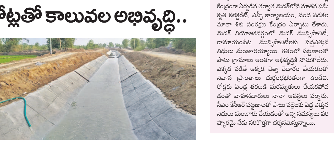
ఆధునికీకరించిన మహబూబ్ నగర్ కాలను

రూ.55 కోట్లతో ప్రభుత్వానికి ప్రతిపాదనలు పంపారు. 2022 బడ్జెట్లో రూ.50.35 కోట్లు ఎంఎన్, ఎస్ఎన్ కాలనుల సీమెంట్ లైనింగ్ పనులు నిలిపివేయాలి. దీంతో నీటి పారుదల శాఖ అధికారులు ఎంఎన్, ఎస్ఎన్ రూ.21 కోట్లు కేటాయించారు. ఈ పనులు