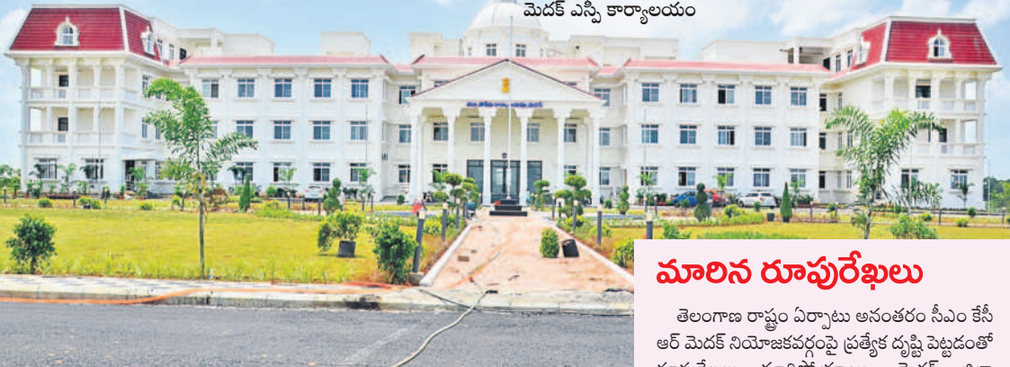
మెదక్ ఎస్సీ కార్యాలయం

మెతుకునీమ మెదక్ ప్రాంతం తొమ్మిదేళ్లలో అనూహ్య ప్రతిగా సాధించింది. మెదక్ నియోజకవర్గంలోని మెదక్, రామాయంపేట మున్సిపాలిటీలను కవర్ చేస్తూ, మెదక్ ప్రభుత్వం అభివృద్ధి చేసింది. మెదక్ జిల్లా కేంద్రంలోని గోసంధ్రం చెరువును రూ.9 కోట్లతో మెన్ ట్యాంకంబండ్ గా అభివృద్ధి చేసింది. మెదక్ పట్టణంలో రూ.20 కోట్లతో మాతాశివ సంరక్షణ కేంద్రాన్ని ప్రభుత్వం నిర్మించింది. రూ.180 కోట్లతో మెడికల్ కళాశాల ఏర్పాటు చేస్తున్నది. మిషన్ కాకతీయలో రూ.340 కోట్లతో చెరువులను అభివృద్ధి చేసింది. జిల్లా కేంద్రంలో 32 ఎకరాలలో రూ.67.07 కోట్లతో సమీకృత కలెక్టరేట్, 63 ఎకరాలలో రూ.38.50 కోట్లతో రాజవనాన్ని తలపించేలా జిల్లా ఎస్సీ కార్యాలయాన్ని బీఆర్ఎస్ సర్కారు నిర్మించింది. రూ.50 కోట్లతో మహబూబ్ నగర్ పత్తేనగర్ కాలనుల సీమెంట్ లైనింగ్ పనులు పూర్తిచేసింది. మెదక్ నియోజకవర్గంలోని మెదక్ మండలం ర్యాలను దుగు హబ్ నీరును రూ.20.98 కోట్లతో చెక్ డ్యాం, మంజీర వాగుపై హవేళీఘనపూర్ మండలం సర్దన గ్రామంలో రూ.12.15 కోట్లతో చెక్ డ్యాం నిర్మించడంతో రైతులకు సాగునీటి బెంగిలింది.