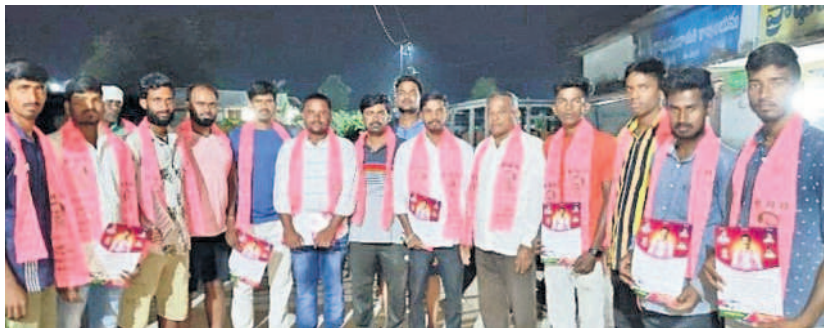
దొల్తాబాద్ మండలం మల్లేశంపల్లిలో బీఆర్ఎస్లో చేరిన బీజేపీ కార్యకర్తలు