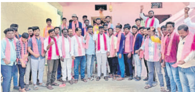
మిరుదొడ్డి: బీఆర్ఎస్లో చేరుతున్న బీజేపీ, కాంగ్రెస్ నాయకులు