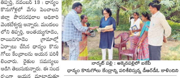
నార్కట్ పల్లి : అక్కెనపల్లిలో ఐకేపీ ధాన్యం కొనుగోలు కేంద్రాన్ని పరిశీలిస్తున్న డీఆర్ డి. కాలిందిని

తిప్పర్తి, నవంబర్ 13 : ధాన్యం కొనుగోళ్లలో వేగం పెంచాలని జిల్లా పౌరసరఫరాల అధికారి వెంకటేశ్వర్లు అన్నారు. మండలంలోని తిప్పర్తి, అంతయ్యగూడెం, రాయినిగూడెం గ్రామాల్లో ఏర్పాటు చేసిన ధాన్యం కొనుగోలు కేంద్రాలను ఆయన పరిశీలించారు. రైతుల సమస్యలు అడిగి తెలుసుకున్నారు. ఈ సందర్భంగా ఆయన మాట్లాడుతూ వాసకాలం సీజన్లో కొనుగోలు కేంద్రాల ద్వారా రైతులకు ప్రభుత్వం మద్దతు ధర ఇస్తుందన్నారు. ఇప్పటివరకు జిల్లావ్యాప్తంగా 22,677 మంది రైతుల వద్ద 1,64,350 మెట్రిక్ టన్నుల ధాన్యం కొనుగోలు చేసినట్లు తెలిపారు. రూ.167.86 కోట్లు రైతుల ఖాతాలో జమ చేసినట్లు తెలిపారు. కార్యక్రమంలో డీఎం నాగేశ్వర్ రావు, డిటీసీఎస్ లింగస్వామి పాల్గొన్నారు.