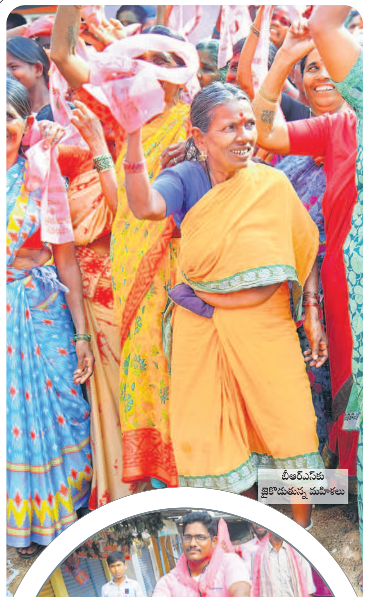
బీఆర్ఎస్ కు జైకొడుతున్న మహిళలు