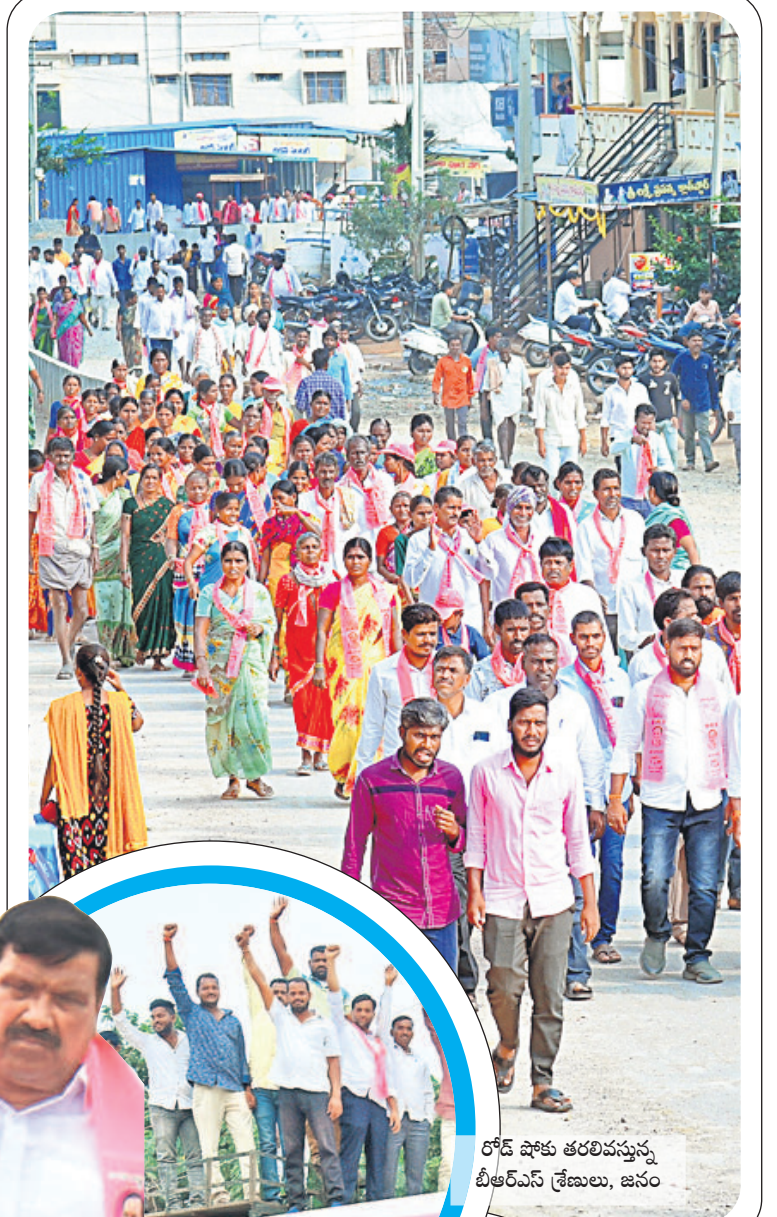
రోడ్ షోకు తరలివస్తున్న బీఆర్ఎస్ శ్రేణులు, జనం