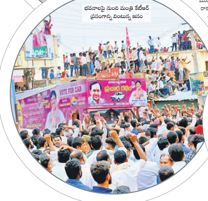
భవనాలపై నుంచి మంత్రి కేటీఆర్ ప్రసంగాన్ని వింటున్న జనం