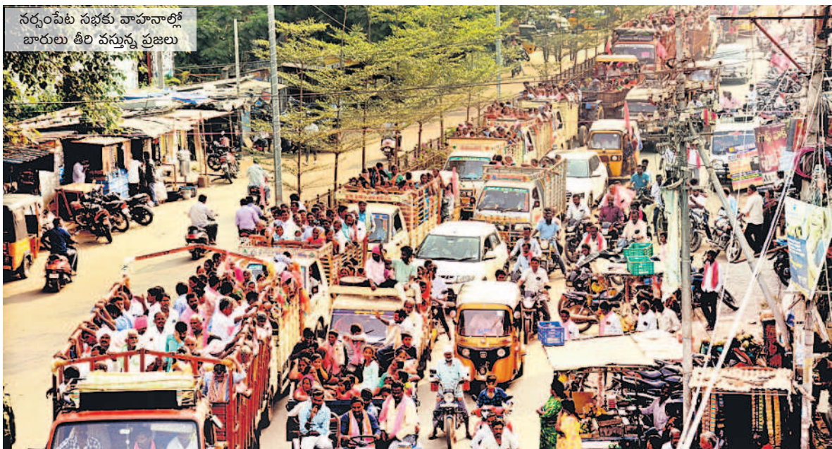
నర్సంపేట సభకు వాహనాల్లో భారులు తీరి వస్తున్న ప్రజలు