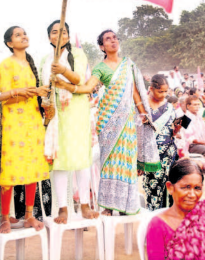
కేసీఆర్ సభలో గులాబీ జెండాతో..