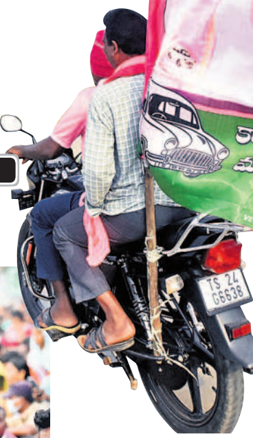
జైకాదు గులాబీ జెండాతో సభకు వస్తూ..