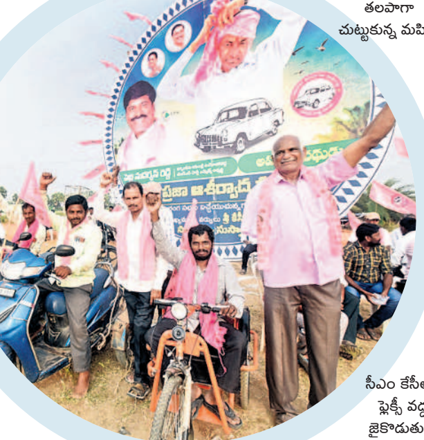
సీఎం కేసీఆర్ షెక్సీ వద్ద జైకాదుతున్న దివ్యాంగులు

ఆకట్టుకున్న రౌండ్ షెక్సీలు.. సభలో ఏర్పాటు చేసిన రౌండ్ షెక్సీలు ప్రత్యేక ఆకర్షణగా నిలిచాయి. ప్రాంగణంలో 20కి మైగ రౌండ్ షెక్సీలు ఏర్పాటు చేశారు. షెక్సీలో ఫూచర్ ఆఫ్ ఇండియా అని పేర్కొంటూ సీఎం కేసీఆర్, ఎమ్మెల్యే పెద్ది ఫోటోలు, కారు గర్జ ముద్రించగా ప్రజలు ఆసక్తిగా తిలకించారు