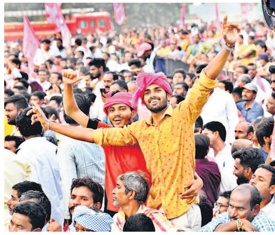
నర్సంపేట ప్రజా ఆశీర్వాద సభలో ఉత్సాహంతో నృత్యం చేస్తున్న యువకులు