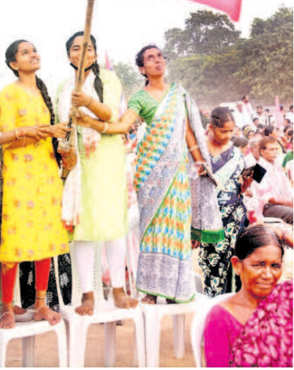
కేసీఆర్ సభలో గులాబీ జెండాతో..