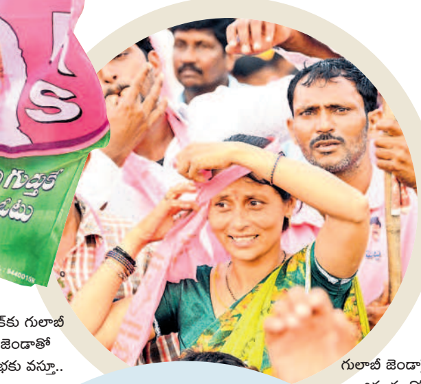
గులాబీ జెండాపై అభిమానంతో తలవగా మట్టుకున్న మహిళ

ఆకట్టుకున్న రౌండ్ షెక్సీలు.. సభలో ఏర్పాటు చేసిన రౌండ్ షెక్సీలు ప్రత్యేక ఆకర్షణగా నిలిచాయి. ప్రాంగణంలో 20కి మైగ రౌండ్ షెక్సీలు ఏర్పాటు చేశారు. షెక్సీలో ఫూచర్ ఆఫ్ ఇండియా అని పేర్కొంటూ సీఎం కేసీఆర్, ఎమ్మెల్యే పెద్ది ఫోటోలు, కారు గర్జ ముద్రించగా ప్రజలు ఆసక్తిగా తిలకించారు