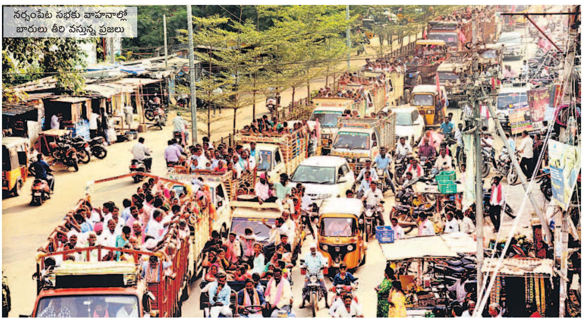
నర్సంపేట సభకు వాహనాల్లో భారులు తీరి వస్తున్న ప్రజలు