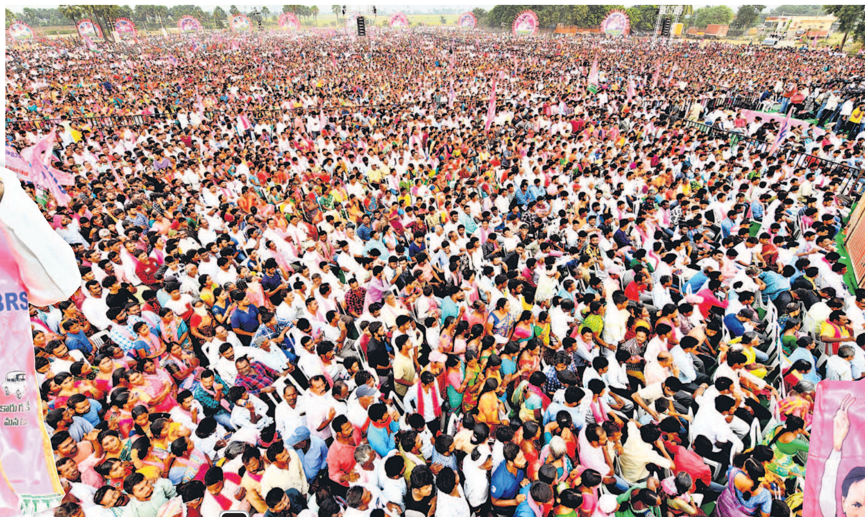
నర్సంపేట ప్రజా ఆశీర్వాద సభకు భారీగా తరలివచ్చిన జనం. అభివాదం చేస్తున్న సీఎం కేసీఆర్