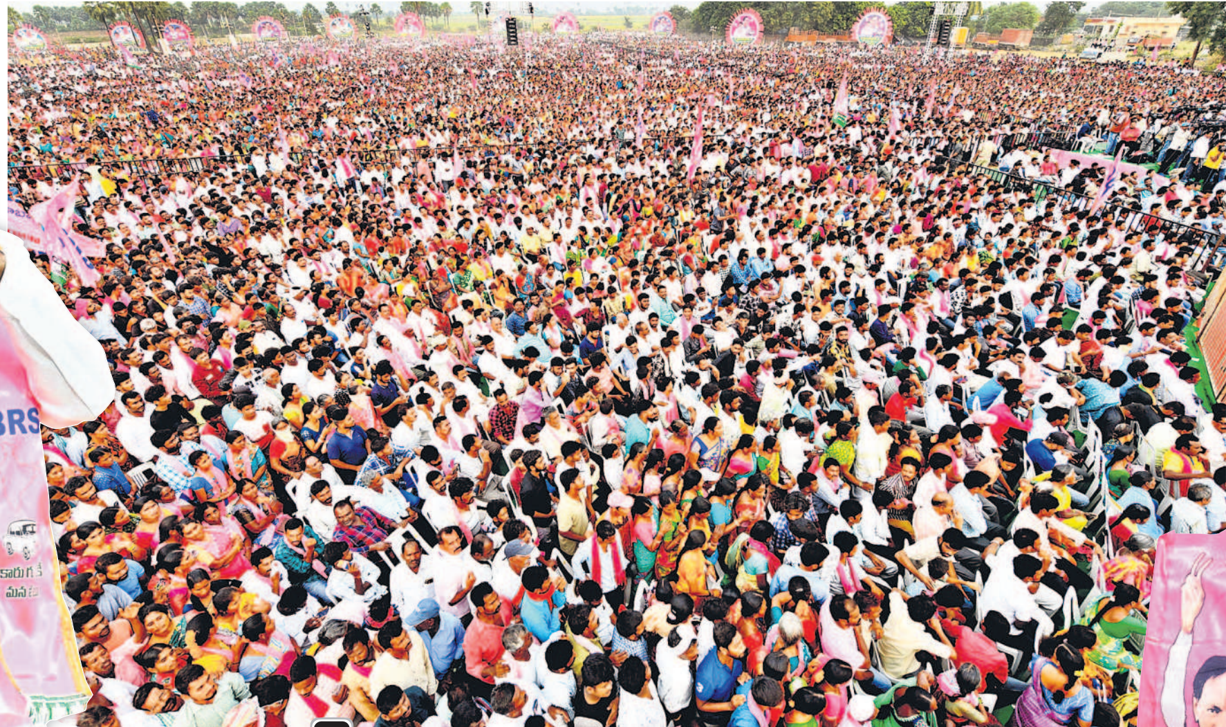
నర్సంపేట ప్రజా ఆశీర్వాద సభకు భారీగా తరలివచ్చిన జనం. అభివాదం చేస్తున్న సీఎం కేసీఆర్