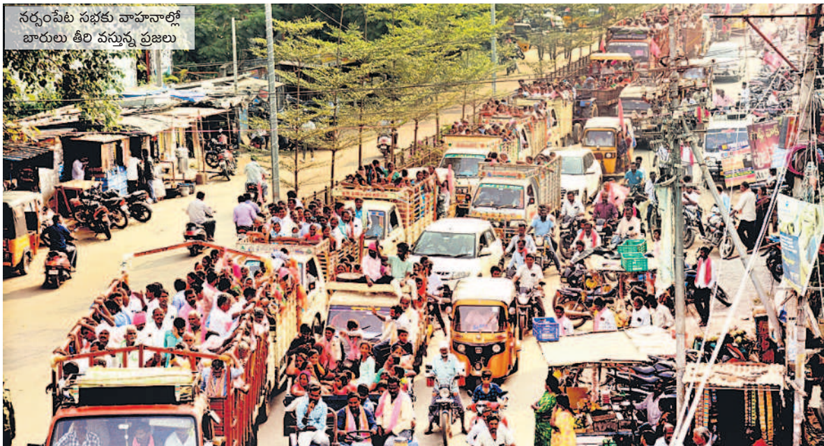
నర్సంపేట సభకు వాహనాల్లో భారులు తీరి వస్తున్న ప్రజలు

భారీ బందోబస్తు ప్రజా ఆశీర్వాద సభకు సీపీ అంబర్ కిశోర్ రూా ఆధ్వర్యంలో పోలీసులు భారీ బందోబస్తు కల్పించారు. వరంగల్ క్రాస్ జోన్ డీసీపీ పీ రవీందర్, నలుగురు ఏసీపీలు, 14మంది సీబిలు, 40మంది ఎస్సెలు, 89మంది ఏఎస్సెలు, 94మంది హెడ్ కానిస్టేబుళ్లు, 78మంది మహిళా పోలీసులు, 180మంది కానిస్టేబుళ్లు, హోంగార్లు, ఇతర సిబ్బంది కలిపి మొత్తం 480మంది విడులు నిర్వహించారు.