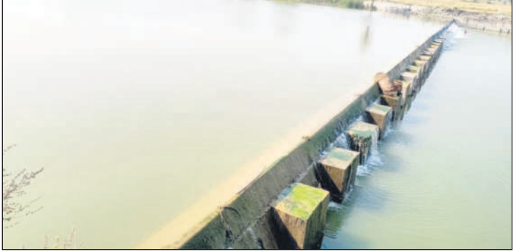
వీణవంకలో మత్తడి పడుతున్న చెక్ డ్యాం

వీణవంక, నవంబర్ 13: తలాపున సముద్రం ఉన్నా చాప దూపకు ఏడ్చినట్లు ఉండేది ఒకప్పుడు వీణవంక ప్రాంత రైతులు, ప్రజల పరిస్థితి.