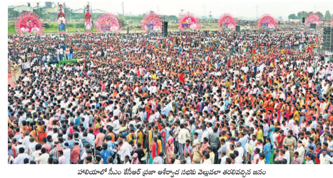
హరీశ్ రావు సీఎం కేసీఆర్ ప్రజా ఆశీర్వాద సభకు వెళ్ళుతూ తరలివచ్చిన జనం