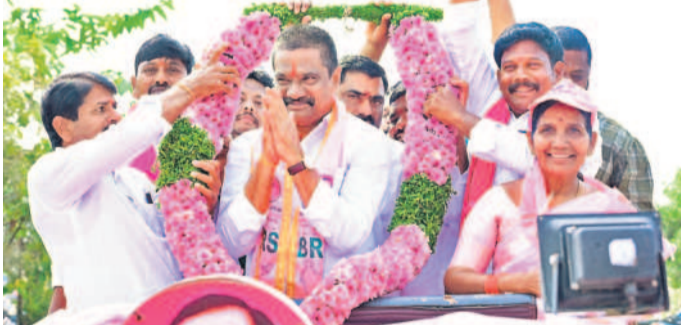
మెండోరా మండలం ఎల్యూటార్ లో మంత్రి వేములను సన్మానిస్తున్న గ్రామస్థులు