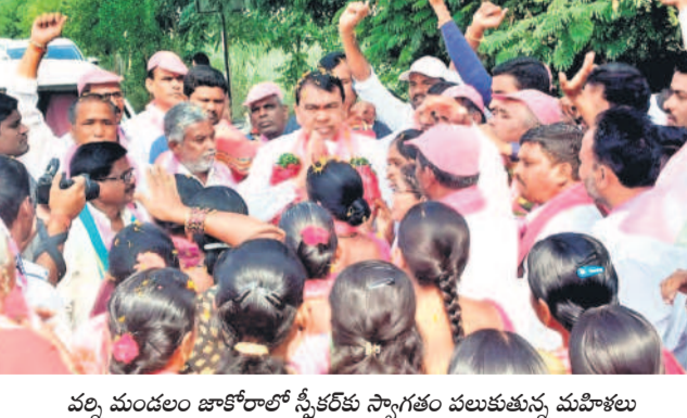
వచ్చి మండలం జాకోరాల్లో స్వీకరణ స్వాగతం వలుతున్న మహిళలు

శ్యామలంగా, ప్రకాశంగా ఉండాలంటే బీఆర్ఎస్ పార్టీకి మద్దతిచ్చి సీఎం కేసీఆర్ ప్రజా త్యాన్ని మూడోసారి గెలిపించాలని పిలుపునిచ్చారు. తొమ్మిదవ రోజున అభివృద్ధిని చూసి డిసెంబర్ 30న ఆరోపించి ఓడిపోయిన సూచించారు. తొమ్మిదవ రోజున మూడోసారి కింద రూ.2,340 కోట్ల నిధులిచ్చారు. ఆర్ఎస్ఎస్ నిబంధనలను తీసుకువచ్చినది విమర్శించారు. ఈ తొమ్మిదవ రోజున కాంగ్రెస్ ప్రభుత్వం కొట్టి నిబంధనలను తీసుకువచ్చినది విమర్శించారు. ఈ తొమ్మిదవ రోజున కాంగ్రెస్ ప్రభుత్వం కొట్టి నిబంధనలను తీసుకువచ్చినది విమర్శించారు.