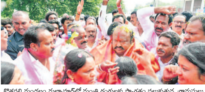
కొత్తపల్లి మండలం మల్కాపూర్ లో మంత్రి గంగులకు స్వాగతం వలుతున్న గ్రామస్థులు

గ్గా కరెంట్ ఇవ్వలేక రైతులతో నిరసనలు ఎదుర్కొంటున్నారని ఆరోపించారు. నిజామాబాద్ జిల్లా మెండోరా మండలంలో మంగళవారం ఎన్నికల ప్రచారం నిర్వహించారు. కాంగ్రెస్ పార్టీకి ఓటు వేస్తే తెలంగాణలో కూడా మళ్లీ కరెంట్ కష్టాలు తప్పవని హెచ్చరించారు.