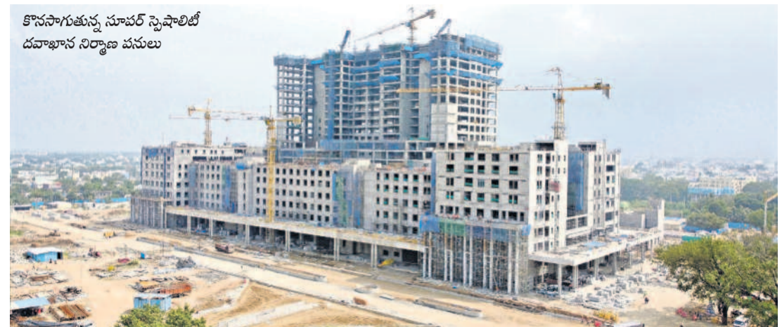
కొనసాగుతున్న సూపర్ స్టెషియల్ దవాఖాన నిర్మాణ పనులు