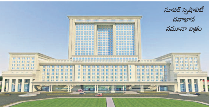
సూపర్ స్పెషియల్ దవాఖాన నిర్మాణ పనులు

సూపర్ స్పెషియల్ హాస్పిటల్ పనులు సాగుతున్నాయి. వరంగల్లోని ఎంజీఎం హాస్పిటల్, కాకతీయ మెడికల్ కాలేజీ, కంటి దవాఖాన, సింథెటిక్ జైలు స్టేషన్ కంటికి 200 ఎకరాల వరకు అభివృద్ధి.. ఆ ప్రాంతాన్ని ఇంటిగ్రేటెడ్ హెల్త్ కాంప్లెక్స్ గా అభివృద్ధి చేయనున్నట్లు సీఎం కేసీఆర్ ప్రకటించారు. దీనిలో భాగంగానే వరంగల్ వర్సిటీని ఏర్పాటు చేసి కాళీ నారాయణరావు యూనివర్సిటీ ఆఫ్ హెల్త్ సైన్సెస్ గా పేరు ఏర్పాటు చేశారు. అనంతరం ఐదు ఎకరాలలో రూ.25 కోట్లతో ఐదు అంతస్తులతో 89 వేల చదరపు అడుగుల విస్తీర్ణంలో అత్యాధునిక భవనాన్ని నిర్మించారు. ఈ భవనం పక్కనే ఉన్న స్టేషన్లో ఇప్పుడు