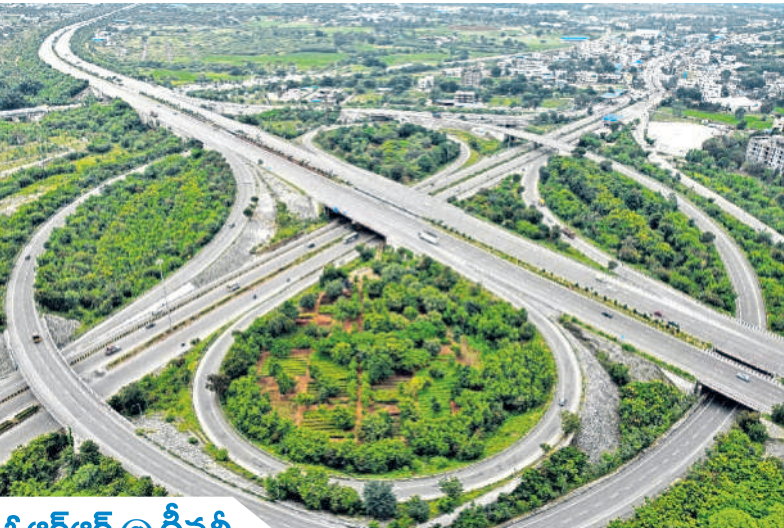
ఓఆర్ఆర్ @ గ్రీన్సీ..

జవహర్లాల్ నెహ్రూ ఔట్రీచ్ లింగ్ రోడ్డు పక్కననుండే కళకళలాడుతున్నది. హరితహారంలో భాగంగా ప్రభుత్వం ఇప్పటికే అనేక చెట్లను పెంచుతుండగా, హెచ్ఎంసీలోని అర్బన్ ఫార్మిస్టింగ్ వింగ్, హైదరాబాద్ గ్రోత్ కాలడార్ లిమిటెడ్లు ఓఆర్ఆర్ మట్టుపక్కల పచ్చదనాన్ని పెంపొందించేలా పచ్చలు తీసుకుంటున్నాయి. 2022 ఏడాదికి సంబంధించి 'ఇంటిగ్రేషన్లో అసోసియేషన్ ఆఫ్ హార్టికల్చర్ ప్రొడ్యూసర్స్' హైదరాబాద్కు 'చరల్డ్ గ్రీన్ సీటీ అవార్డు'ను ప్రకటించింది.