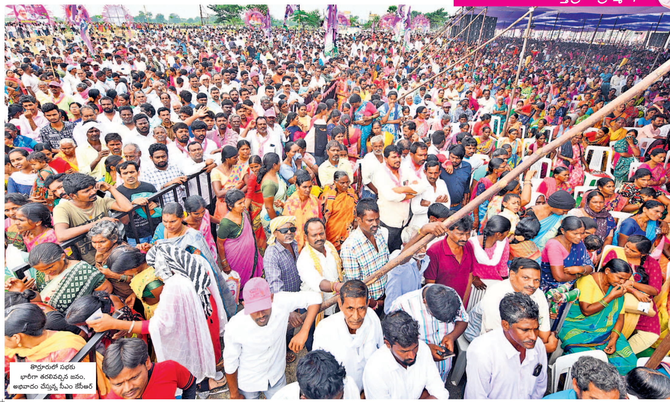
తొర్రూరులో సభకు భారీగా తరలివచ్చిన జనం, అభివాదం చేస్తున్న సీఎం కేసీఆర్