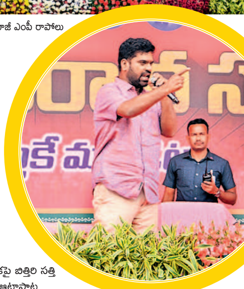
వేదికపై బిల్లి సత్తి ఆటాపాట

మంత్రి దయాకర్ రావును చెక్ డౌన్ల రావు అని అభివృద్ధిస్తూ సీఎం కేసీఆర్ కిర్యానివ్వడంతో సభలో నవ్వులు వెల్లివిరిశాయి. నియోజకవర్గ అభివృద్ధికి ఆయన పడుతున్న కష్టం మామూలుది కాదని, మూడుసార్లు వర్షపువేటి ఎమ్మెల్యేగా, మూడుసార్లు పాలకుర్తి ఎమ్మెల్యేగా వరుస విజయాలతో ఈ ప్రాంతాల అభివృద్ధికి పని చేస్తూనే అవకాశం దొరికినప్పుడల్లా ఆకేరు, పాలేరు, యక్కంకాపూర్ వాగులపై చెక్ డౌన్లకు నిధులు మంజూరు చేయించుకుని 35 నుంచి 40 చోట్ల నిర్మాణాలు చేయించాడని గుర్తుచేశారు. 'మేమంతా ఆయనను దయాకర్ రావు కాదు చెక్ డౌన్ల రావు అని పేరు పెట్టుకున్నం' అని సీఎం చెప్పగానే సభలో నవ్వులు విరబూశాయి. 'అమెరికా నుంచి పాలకుర్తికి వచ్చి నాలుగు రోజుల మురిపెం చూపెట్టి టోపిపెట్టి పోయేట్లోనూ జనం పట్టించుకోవద్దు. కరోనా వంటి కష్టకాలంలో మీ వెంట ఉండి ధైర్యార్పాల్చిన దయాకర్ రావును ఛార్జి మెజిస్ట్రేట్ గెలిపించారో' అని ప్రజలకు ముఖ్యమంత్రి పిలుపునిచ్చారు. సభ ముగిసిన తర్వాత వేలాది మంది జన సందోహం నడుమ దయాకర్ రావు తన వాహనం పైనుంచి అభివాదం చేస్తూ ముందుకు సాగారు. గంటకు పైగా సభా ప్రాంగణం నుంచి అంతేవేగం సెంటర్ వరకు వాహనాల ర్యాలీ కొనసాగగా దయాకర్ రావు వాహనం ముందు యువకులు, గిరిజన మహిళలు, వివిధ గ్రామాల నుంచి వచ్చిన బీఆర్ఎస్ శ్రేణులు డ్యాన్సులు చేస్తూ 'దయాకర్ రావు గెలుపు ఖాయం' అంటూ పెద్ద ఎత్తున నినాదాలు చేశారు.