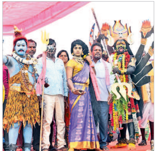
వివిధ వేషధారణల్లో కళాకారుల ప్రదర్శనలు