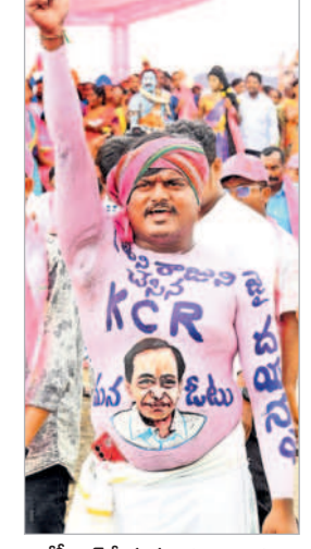
'కేసీఆర్ కే మన ఓటు' అంటూ నినదించున్న బీఆర్ఎస్ అభిమాని