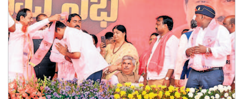
కాంగ్రెస్ కార్యకర్తలకు గులాబీ కండువా కప్పి బీఆర్ఎస్ లోకి ఆహ్వానిస్తున్న సీఎం కేసీఆర్