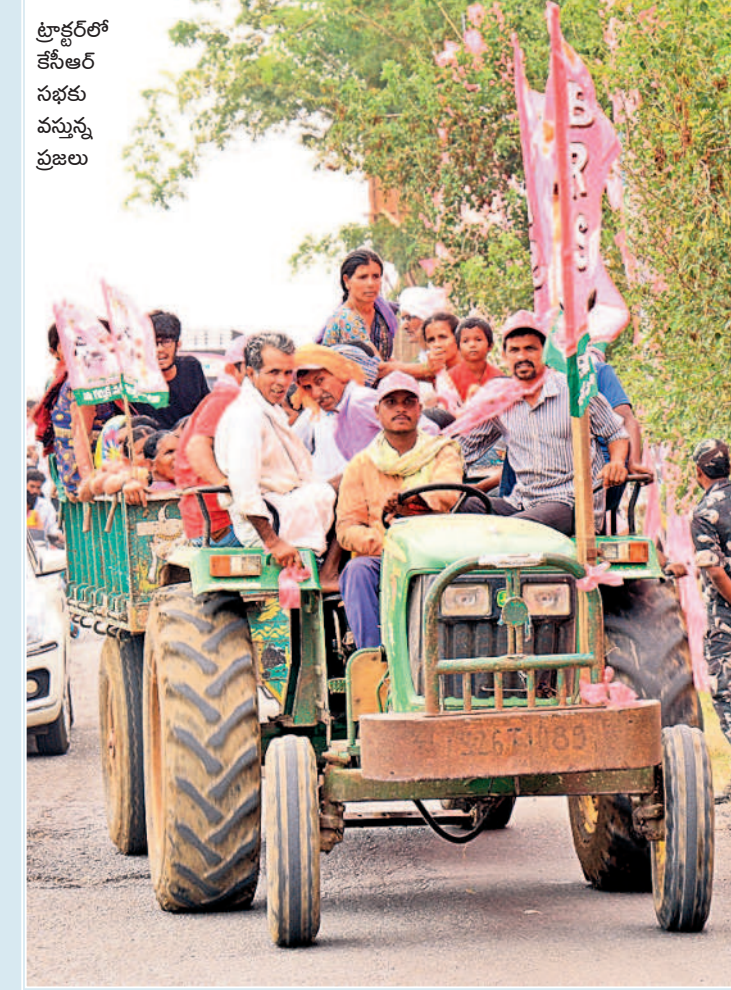
ట్రాక్టర్లో కేసీఆర్ సభకు వస్తున్న ప్రజలు