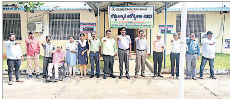
బొగ్గు నాణ్యత వారోత్సవాల ప్రతిజ్ఞ చేస్తున్న అధికారులు, ఉద్యోగులు

'నాణ్యత మా బాధ్యత-వినియోగదారుడి సంతృప్తియే మా ప్రాధాన్యత.., నాసిరకం బొగ్గు వద్దు-నాణ్యమైన బొగ్గు ముద్దు.., షేల్ మరియు బండలు ఏరేద్దాం-బొగ్గు నాణ్యతను పెంచేద్దాం.., నాణ్యమైన బొగ్గును ఉత్పత్తి చేద్దాం-కంపెనీ ప్రాధాన్యతను పెంచుదాం.., బొగ్గు ఉత్పత్తి మా వృత్తి-నాణ్యత మా ప్రవృత్తి..' అనే నినాదాలతో సింగరేణి యాజమాన్యం నవంబర్ 9వ తేదీన బొగ్గు నాణ్యతా వారోత్సవాలు