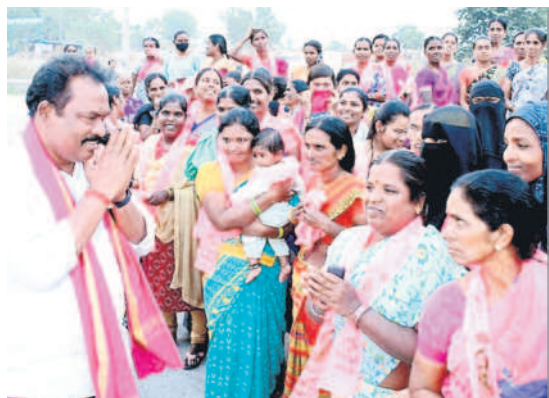
గంగాధర: మధురానగర్ లో మహిళలను ఓటు అభ్యర్థిస్తున్న బీఆర్ఎస్ అభ్యర్థి, ఎమ్మెల్యే రవిశంకర్

కరీంనగర్ రూరల్: దుర్గ్ లో ఉపసర్పంచ్ సుంకిశాల సంవత్సరాపు అభ్యర్థులలో వ్యూహాలని ఓటు అభ్యర్థిస్తూ..