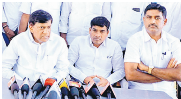
మానకొండూర్ రూరల్: విలేకరుల సమావేశంలో మాట్లాడుతున్న రాష్ట్ర ప్రణాళికా సంఘం ఉపాధ్యక్షుడు బోయినపల్లి వినోద్ కుమార్