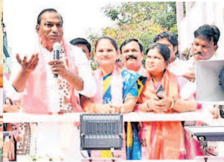
మేడ్చల్ లో నిర్వహించిన ఎన్నికల ప్రచారంలో ప్రజలను ఉద్దేశించి మాట్లాడుతున్న మంత్రి మల్లారెడ్డి