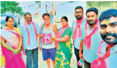
కీసర్ లో మంత్రికి మద్దతుగా ప్రచారం చేస్తున్న బీఆర్ఎస్ శ్రేణులు