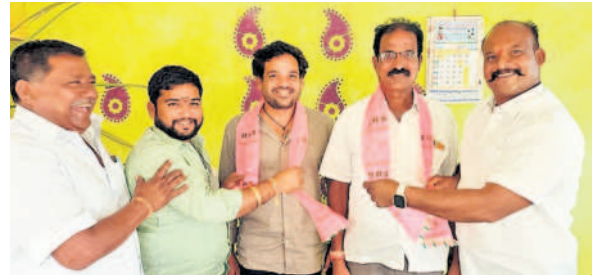
ఘట్టేసర్ రూరల్ : ఎదులాబాద్ లో చందువల్లి ధర్మారెడ్డి అధ్యక్షులలో బీఆర్ఎస్ లో చేరుతున్న కాంగ్రెస్ నాయకులు