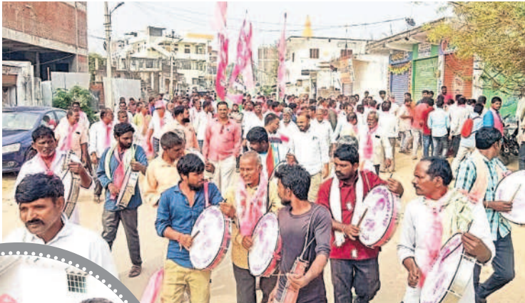
6, 7 వార్డుల్లో డప్పు చప్పుళ్లతో ప్రచారం..