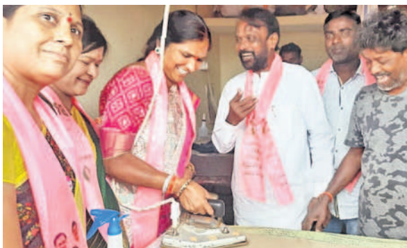
లాండ్లీ షాపిలో ఇస్త్రీ చేస్తున్న ఎమ్మెల్యే పద్మాదేవేందర్ రెడ్డి