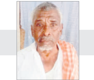
❖ మూడోసారి సీఎంసె చేస్తాం..

కోటపల్లి, నవంబర్ 14 : తెలంగాణ సీఎం కేసీఆర్ ప్రవేశపెట్టిన రిజర్వేషన్లతోనే నేను ఎంపీపీ అయ్యాను. రాజకీయంగా మహిళలు ఎదగాలని, ప్రజా సమస్యల పరిష్కారంలో, పాలనలోనూ ముందుగా పనిచేయాలని మహిళలకు రిజర్వేషన్ల శాతం పెంచడంతో కోటపల్లి ఎంపీటీసీ జనరల్ మహిళా స్థానం నుంచి పోటీ చేసి విజయం సాధించాను. కోటపల్లి ఎంపీపీ స్థానం ఎన్నో మహిళలకు రిజర్వే టాగా, ఎంపీపీగా ఎన్నికై, సేవలు అందిస్తున్నా. ప్రజలకు మెరుగైన పాలన అందించాలనే లక్ష్యంతో ప్రజల సమస్యలను పరిష్కరిస్తూ, ముందుకు సాగుతున్నా. రిజర్వేషన్లలో మహిళల స్థానం కేటాయింపుతోనే చాలా మంది మహిళలు నేడు ఎంపీపీ, జడ్పీటీసీ, సర్పంచ్లు కావడం జరుగడం వారు. కోటపల్లిలో సెంట్రల్ లైటింగ్ తో పాటు సీసీ రోడ్లు, డ్రైనేజీలు నిర్మించి ప్రజల సమస్యలను పరిష్కరించడంలో నా వంతు పాత్ర పోషించిన. ప్రభుత్వ విధి బాల్కు సుమన సహకారంతో ఎన్నో ప్రభుత్వ కార్యక్రమాల్లో పాల్గొని, ప్రజలకు ఆదర్శపథమైన పాలన అందిస్తున్నా. - మంత్రి సురేఖ, ఎంపీపీ, కోటపల్లి