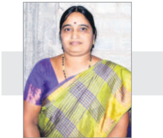
❖ రిజర్వేషన్లతోనే ఎంపీపీ అయిన..