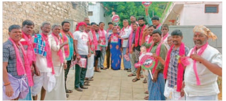
దేవరకర్త : జిన్నరాలలో ప్రచారం చేస్తున్న కార్యకర్తలు