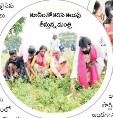
కూలీలతో కలిసి కలుపు తీస్తున్న మంత్రి