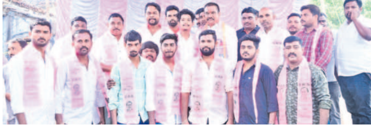
బీఆర్ఎస్లో చేరిన వారితో మంత్రి వేముల ప్రశాంత్ రెడ్డి

వేల్పూర్, నవంబర్ 14 : రాష్ట్ర ప్రభుత్వం చేపట్టిన అభివృద్ధి పనులు, అమలుచేస్తున్న సంక్షేమ పథకాలకు ఆకర్షితులై వివిధ పార్టీలకు చెందిన నాయకులు బీఆర్ఎస్లో చేరుతున్నారు. తాజాగా భీమ్గల్ మండలం బడాభీమ్గల్లోని ఛాలెంజ్ యూత్, రజక రాయల్స్ యూత్, కమ్మర్ పల్లి మండలం