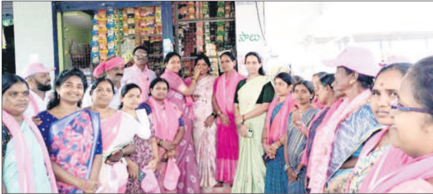
మంథని : పవర్ హాజీకాలనీలో మహిళా బోట్లు పెడుతున్న పుట్ట శైలజ