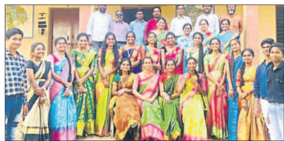
మంథని రూరల్ : బాలల దినోత్సవంలో ఉపాధ్యాయులుగా విద్యార్థులు

కమాన్ పూర్, నవంబర్ 14: భారత తొలి ప్రధాని నెహ్రూ జయంతి సందర్భంగా మండలంలోని పలు పాఠశాలలో మంగళవారం బాలల దినోత్సవం నిర్వహించారు. ఆయా పాఠశాలల్లో విద్యార్థులు జాతీయ నాయకుల వేషధారణలతో హాజరై అలరించారు. స్కూళ్లలో సాంస్కృతిక కార్య