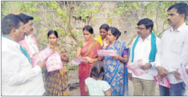
మంథని రూరల్ : లక్ష్మీపూర్లో ఓటు అభ్యర్థిస్తున్న బీఆర్ఎస్ నాయకులు