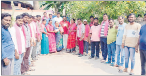
కమాన్ పూర్ : పెంచికల్ పేట్లో ప్రచారం నిర్వహిస్తున్న బీఆర్ఎస్ నాయకులు