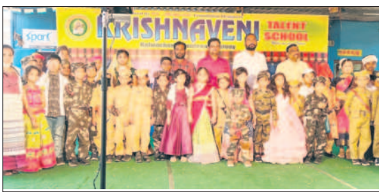
రామగిరి : వేషధారణలో చిన్నారులు