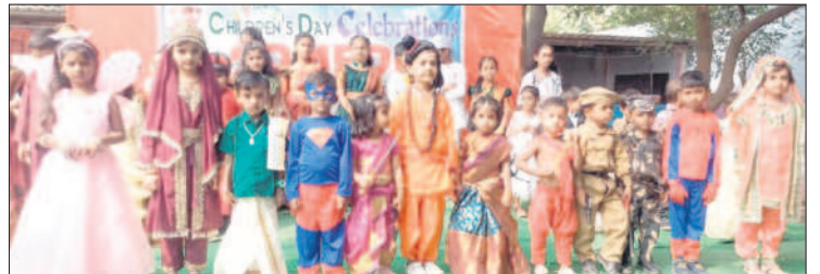
కమాన్ పూర్ : వేషధారణలో చిన్నారులు