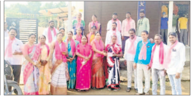
ముత్తూరు : అడవిశ్రీరాంపూర్లో ప్రచారం చేస్తున్న నాయకులు