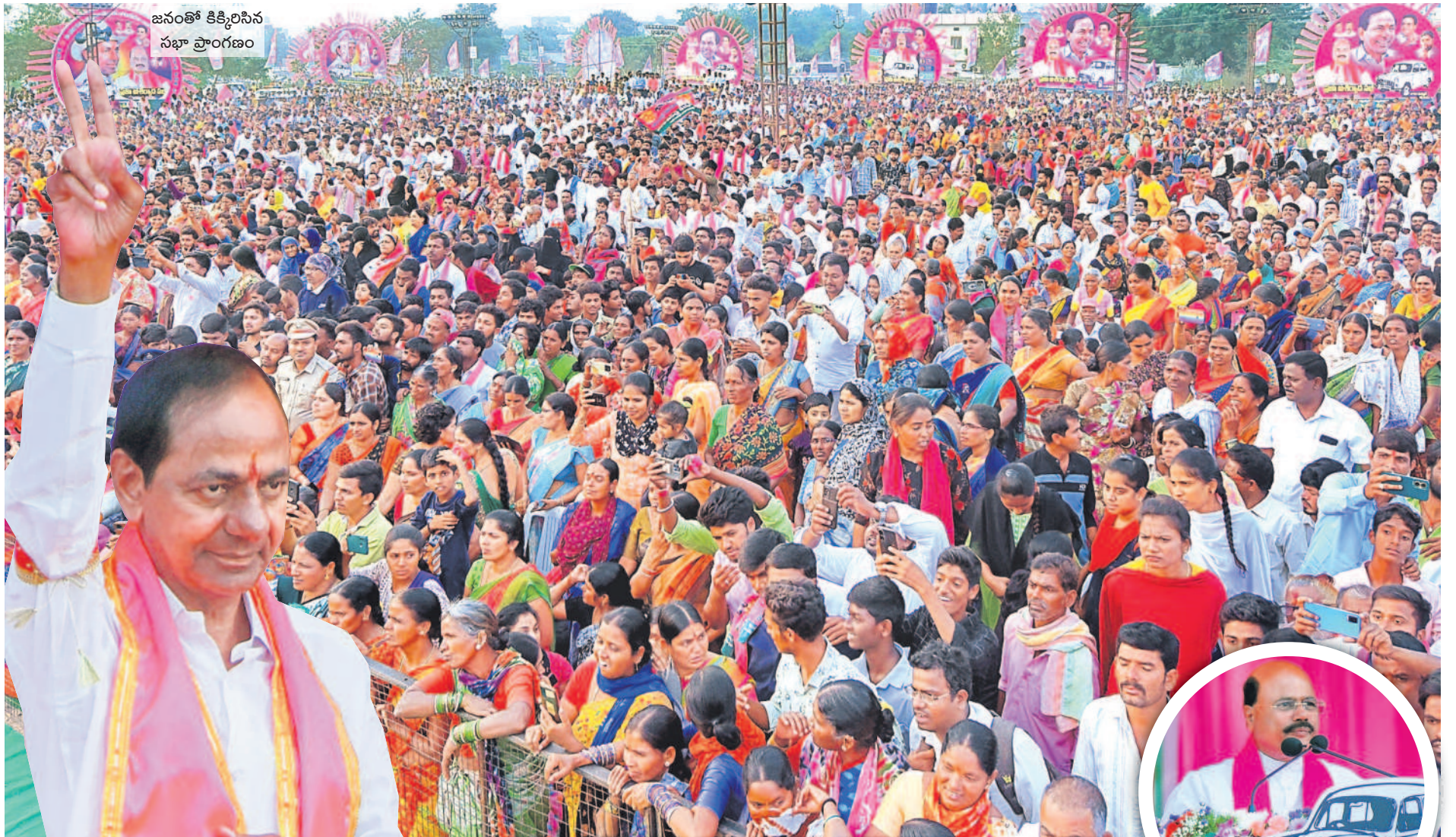
జనంతో కిక్కిరిసిన సభా ప్రాంగణం