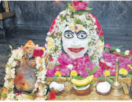
ప్రత్యేక అలంకరణలో శ్రీ గిరిజామృత లింగేశ్వరస్వామి