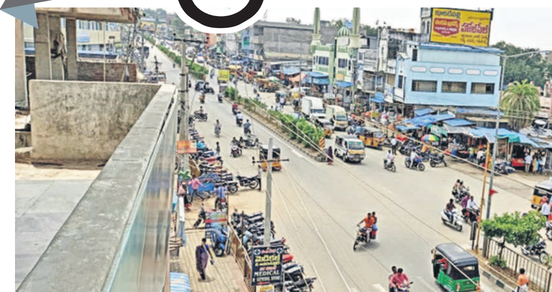
నర్సాపూర్ పట్టణ వ్యా