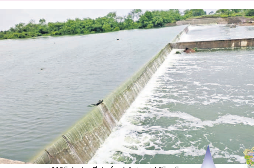
విలిపెచెడ్ మండలంలో మంజీరా నదిపై నిర్మించిన చెక్ డ్యామీ