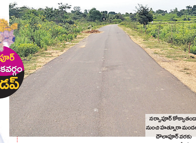
నర్సాపూర్ కోకూతండా నుంచి హత్తూరా మండలం దారిపూర్ వరకు నిర్మించిన జీటీ రోడ్డు