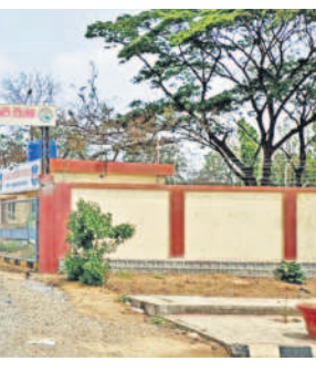
శివంపేట్ మండలం ఏడులాపూర్ గ్రామంలో నిర్మించిన పబ్లిక్ గ్రీన్ వనం

అక్షయ శాత్రాపి వెంపి వాటిని పర్యాటక ప్రాంతాలుగా తీర్చిదిద్దాలనే సంకల్పంతో నర్సాపూర్ అటవీ ప్రాంతంలో అర్చన పార్క్ ను ఏర్పాటు చేసింది. ఇందులో పర్యాటకులకు ఆహ్లాదాన్ని అందించేందుకు టెండ్లముక్కలు, కాలిబర్రులను అధికారులు ఏర్పాటు చేశారు. స్థానికులే కాకుండా హైదరాబాద్ నుంచి కూడా పర్యాటకులు పెద్ద సంఖ్యలో తరలివచ్చి పార్క్ అందాలను వీక్షిస్తున్నారు. పర్యాటకులు బస్ చేయడానికి ఎమ్మెల్యే మదన్ రెడ్డి ప్రత్యేక చొరవతో రూ.3 కోట్లతో నిర్మిస్తున్న కాల్డ్ నీర్ నిర్మాణం పనులు చివరి దశకు చేరుకున్నాయి. వీటి నిర్మాణం పూర్తితే పర్యాటకుల తాకిడి పెరిగి, నర్సాపూర్ పట్టణం పర్యాటక కేంద్రంగా మారనుంది.