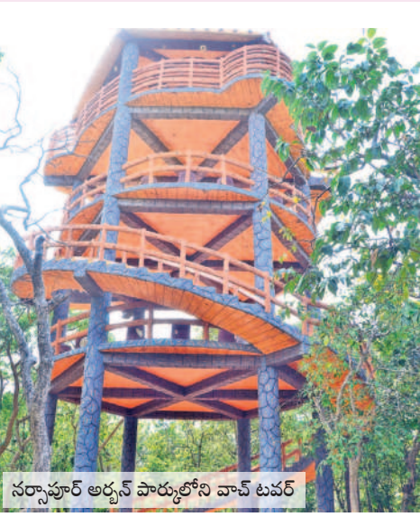
నర్సాపూర్ అర్చన పార్కులోని వాన్ టవర్