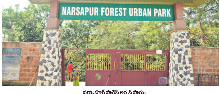
నర్సాపూర్ ఫారెస్టు అర్చన పార్కు

ఆర్డీసీ బస్ డిపో ఏర్పాటు చేయాలన్న నియోజకవర్గ ప్రజల దశకబంధులకు కలను బీఆర్ఎస్ సర్కార్ నెరవేర్చింది. 1998లో బీజేపీ హయాంలో రవాణా శాఖ మంత్రిగా ఉన్న కేసీఆర్ నర్సాపూర్ మండల కేంద్రంలో 5 ఎకరాల్లో బస్ డిపో నిర్మాణానికి శంకుస్థాపన చేశారు. రవాణా కారణాలతో డిపో పనులు లను ప్రారంభించింది. తెలంగాణ చట్టానికి సీఎం కేసీఆర్ 2018లో మున్సిపల్ భవనం, వైకుంఠ ఠాండం, సెగ్రిగేషన్ షెడ్, గ్రంథాలయం, అండర్ డ్రైనేజ్, ఓపెన్ డ్రైనేజ్, సీసీ రోడ్డు నిర్మాణం పనులు జోరుగా కొనసాగుతున్నాయి.