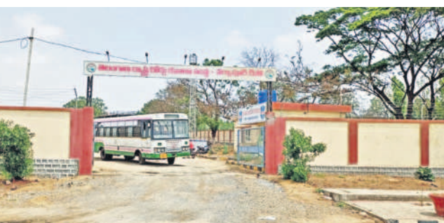
నర్సాపూర్ అర్బన్ పార్కు