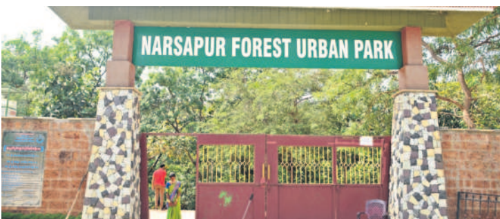
నర్సాపూర్ ఫారెస్టు అర్బన్ పార్కు

ఆర్డీసీ బస్ డిపో ఏర్పాటు చేయాలన్న నియోజకవర్గ ప్రజల దశాబ్దాల కలను బీఆర్ఎస్ సర్కార్ నెరవేర్చింది. 1998లో బీడిఎ హయాంలో రవాణా శాఖ మంత్రిగా ఉన్న కేసీఆర్ నర్సాపూర్ మండల కేంద్రంలో 5 ఎకరాల్లో బస్ డిపో నిర్మాణానికి శంకుస్థాపన చేశారు. రవాణా కారణాలతో డిపో పనులు అను ప్రారంభించింది. తెలంగాణ వచ్చాక సీఎం కేసీఆర్ 2018లో మున్సిపల్ భవనం, వైకుంఠదామం, సెగ్రిగేషన్ షెడ్, గ్రంథాలయం, అండర్ డ్రైనేజ్, ఓపెన్ డ్రైనేజ్, సీసీ రోడ్డు నిర్మాణం పనులు జోరుగా కొనసాగుతున్నాయి.