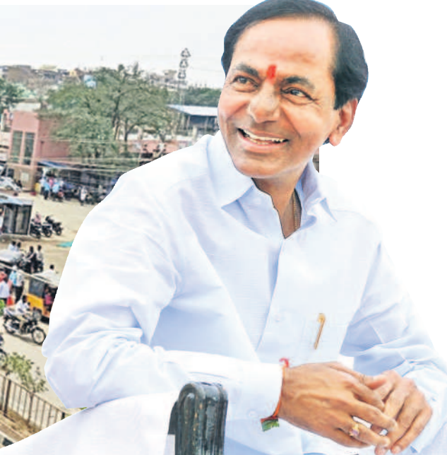
అభివృద్ధిలో దూసుకుపోతున్న నియోజకవర్గం