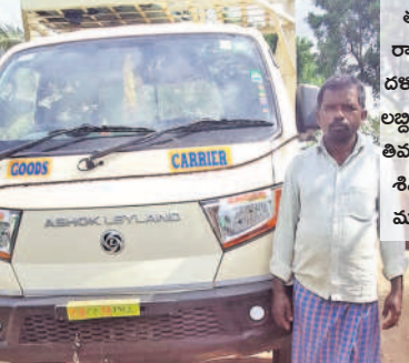
తప్పిడి రాములు, రకతలంబు లక్ష్మణులు, తిమ్మిపూర్, శివంపేట్ మండలం