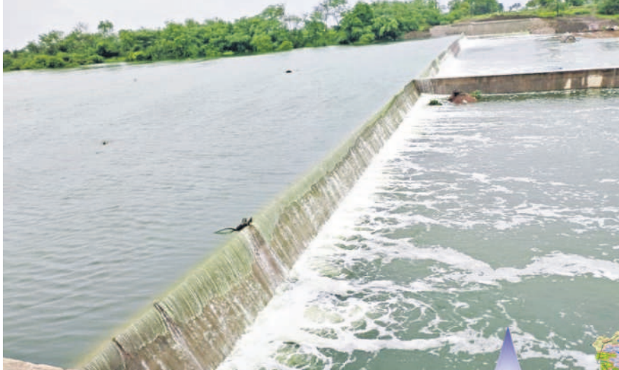
చిలిపిచెడ్డ మండలంలో మంజీరా నదిపై నిర్మించిన చెక్ డ్యామ్