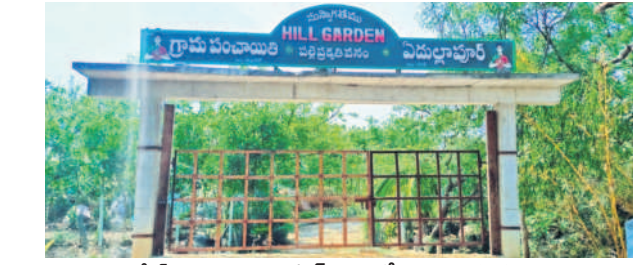
శివంపేట్ మండలం ఏడులాపూర్ గ్రామంలో నిర్మించిన పబ్లిక్ గ్రీన్ పా