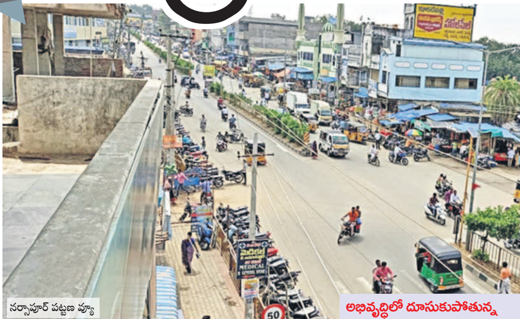
నర్సాపూర్ పట్టణ వ్యా