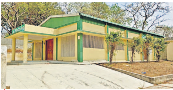
25 రైతు వేదికల నిర్మాణం

వ్యవసాయంలో రైతుల సంహేతులను నిష్పత్తి చేసి వారికి లబ్ధి చేకూర్చాలనే ఉద్దేశంతో రాష్ట్ర సర్కార్ క్లస్టర్ కి ఒక రైతు వేదికను రూ.22 లక్షలు వెచ్చించి 25 రైతు వేదికలు నిర్మించింది. నర్సాపూర్ మున్సిపాలిటీలో 1, మండల పరిధిలో 4 అందుబాటులోకి తెచ్చింది. శివంపేట్ మండలంలో 4, కొల్పూరు మండలం 5, వెల్దుర్తి మండలం 6, కొడిపల్లి మండలం 3, చిలిపిచెడ్డ మండలం 2 ఏర్పాటు చేసింది. ఏకహేతు రైతులకు అందుబాటులో ఉండే రైతు వేదికలో వారి సమస్యలు, సందేహాలు తెలుసుకొని పరిష్కార మార్గాలను చూపిస్తున్నారు.