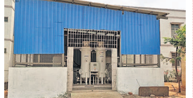
నర్సాపూర్ ప్రభుత్వ ఏరియా దవాఖానలో ఏర్పాటు చేసిన ఆక్సిజన్ ప్లాంట్

కరోనా కష్టకాలంలో ఆక్సిజన్ అందక ఎంతో మంది చనిపోయిన సంఘటనలు మన కళ్ల ముందు ఇంకా మెదులాడుతూనే ఉన్నాయి. ఇలాంటివి పునరావృతం కావద్దని నర్సాపూర్ దవాఖానలో ఆక్సిజన్ ప్లాంట్ను ప్రభుత్వం ఏర్పాటు చేసింది. నర్సాపూర్ మున్సిపల్ పరిధిలోని ప్రభుత్వ ఏరియా దవాఖానలో రూ.50 లక్షలతో 500 ఎల్ఎస్సీ సామర్థ్యంతో ఆక్సిజన్ ప్లాంట్లను ఏర్పాటు చేసింది. దీంతో అత్యవసర పరిస్థితుల్లో దవాఖానలోనే ఆక్సిజన్ను ఉత్పత్తి చేసి రోగులకు అందిస్తుండడంతో మరణాల సంఖ్య తగ్గుముఖం పట్టాయి.