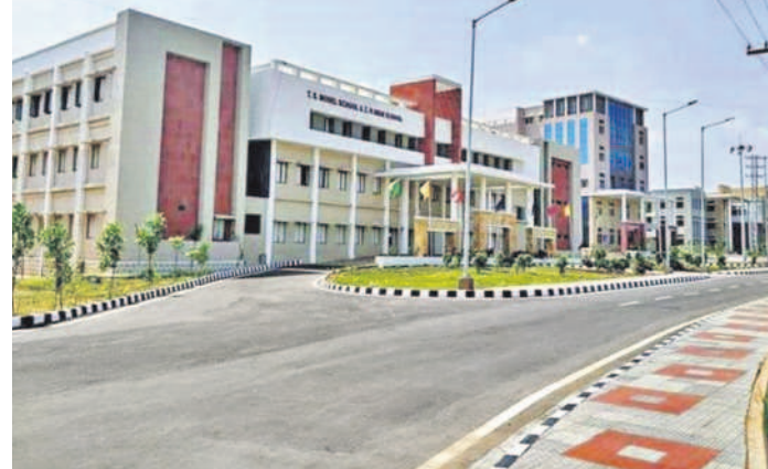
గజ్వేల్ పట్టణంలో ఏర్పాటుచేసిన ఎడ్యుకేషన్ హాల్