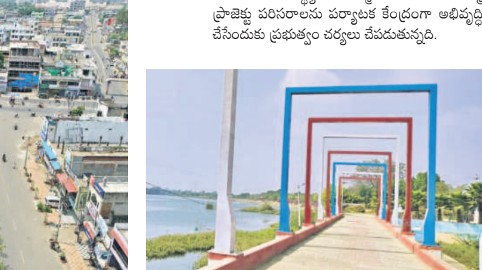
పాండవుల చెరువు మినీ ట్యాంక్ బండ్

మిషన్ కాకతీయలో భాగంగా గజ్వేల్ పాండవుల చెరువును రూ.8.59 కోట్లు వెచ్చించి మినీట్యాంక్ బండ్ గా మార్చారు. సీఎం కేసీఆర్ స్వయంగా ఈ కట్టను పరిశీలించి పరమర్శలు చేసినా దిశానిర్దేశం చేశారు. ప్రజాపూర్ణ చెరువును రూ.5 కోట్లతో మినీ ట్యాంక్ బండ్ గా అభివృద్ధి చేశారు.