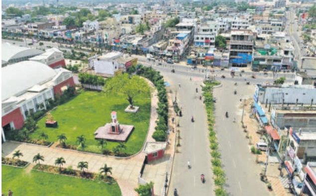
గజ్వేల్ పట్టణం పూర్తి

సీఎం కేసీఆర్ గజ్వేల్ పట్టణం చుట్టూ 22 కిలోమీటర్ల టైల్డ్ లింగ్ రోడ్డు నిర్మాణం కోసం రూ.230 కోట్లు మంజూరు చేశారు. రైల్వే ట్రాక్ల వద్ద 1.6 కిలోమీటర్ల మేర పనులు పెండింగ్ లో ఉండగా, మిగతావి శరవేగంగా పూర్తి చేశారు. టైల్డ్ లింగ్ రోడ్డులో 11 జంక్షన్లు నిర్మిస్తుండగా, ఈ రోడ్డులో 15 కిలోమీటర్ల వరకు 4 లైన్లు, మిగతావి ఆరు వరుసలుగా విస్తరిస్తున్నారు. రిమోవనూడ, శ్రీగిరిపల్లి, పాతూర్ సమీపంలో ట్రాడ్లీల పనులు పూర్తయ్యాయి. ఇరువైపులా జంక్షన్లు నిర్మించి అందంలో ఆకర్షణీయమైన విదేశీ మొక్కలు నాటారు.