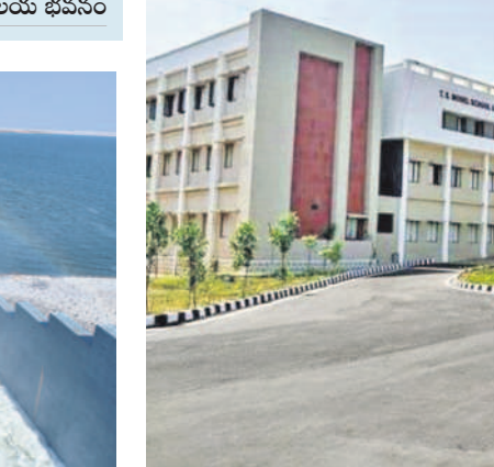
సమీకృత కార్యాలయ భవనం

గజ్వేల్ లో ఒక చోట అన్ని ప్రభుత్వ కార్యాలయాలు ఉండేలా సీఎం కేసీఆర్ చొరవతో సమీకృత కార్యాలయ భవనం అందుబాటులోకి వచ్చింది. హౌసింగ్ బోర్డు కాలనీ పక్కనే 6 ఎకరాల విస్తీర్ణంలో రూ.42.50 కోట్లతో రెండవ భవనం నిర్మించారు. ఇందులో 45 ప్రభుత్వ కార్యాలయ అధికారులు తమ విధులు నిర్వహిస్తున్నారు.