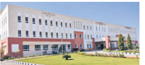
సమీకృత కార్యాలయ భవనం