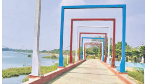
పాండవుల చెరువు మినీ ట్యాంక్ బండ్