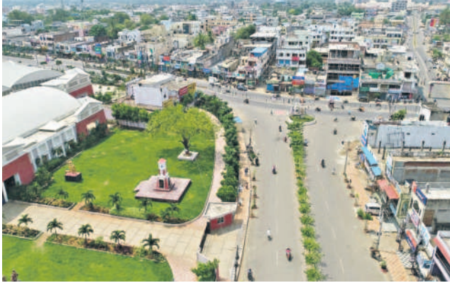
గజ్వేల్ పట్టణం పూర్వ

మిషన్ కాకతీయలో భాగంగా గజ్వేల్ పాండవుల చెరువును రూ.8.59 కోట్లు వెచ్చించి మినీట్యాంక్ బండ్ గా మార్చారు. సీఎం కేసీఆర్ స్వయంగా ఈ కట్టను పరిశీలించి పరమర్శులు చేసినా దిశానిర్దేశం చేశారు. ప్రజాపూర్ణ చెరువును రూ.5 కోట్లతో మినీ ట్యాంక్ బండ్ గా అభివృద్ధి చేశారు.