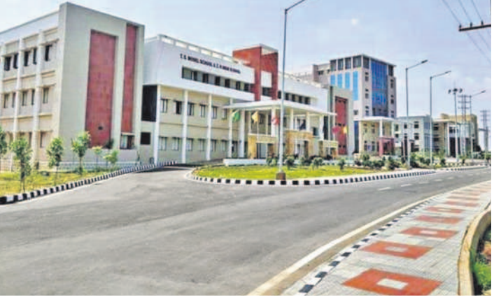
గజ్వేల్ పట్టణంలో ఏర్పాటుచేసిన ఎడ్యుకేషన్ హాల్

గజ్వేల్ లో ఒక చోట అన్ని ప్రభుత్వ కార్యాలయాలు ఉండేలా సీఎం కేసీఆర్ చొరవతో సమీకృత కార్యాలయ భవనం అందుబాటులోకి వచ్చింది. హౌసింగ్ బోర్డు కాలనీ పక్కనే 6 ఎకరాల విస్తీర్ణంలో రూ.42.50 కోట్లతో రెండవ భవనం నిర్మించారు. ఇందులో 45 ప్రభుత్వ కార్యాలయ అధికారులు తమ విధులు నిర్వహిస్తున్నారు.