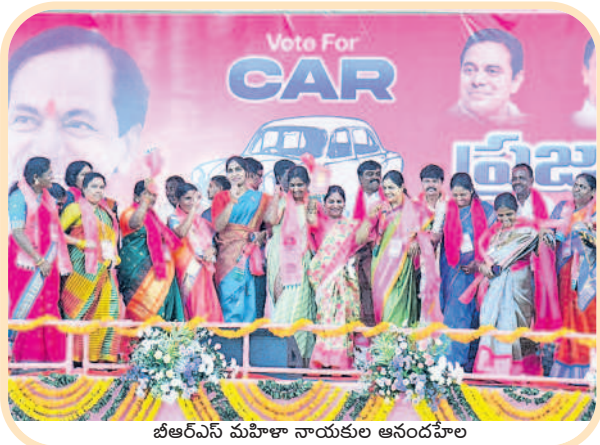
బీఆర్ఎస్ మహిళా నాయకుల ఆనందహాల