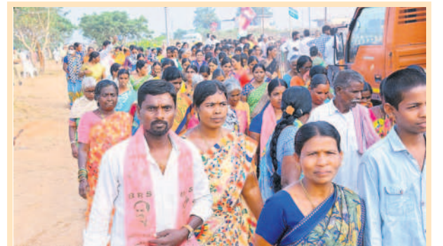
సభకు తరలివస్తున్న జనం