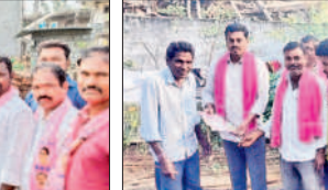
నడికూడ : ఇంటింటా ప్రచారంలో పాల్గొన్న బీఆర్ఎస్ నాయకులు