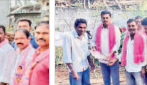
నడికూడ : ఇంటింటా ప్రచారంలో పాల్గొన్న బీఆర్ఎస్ నాయకులు