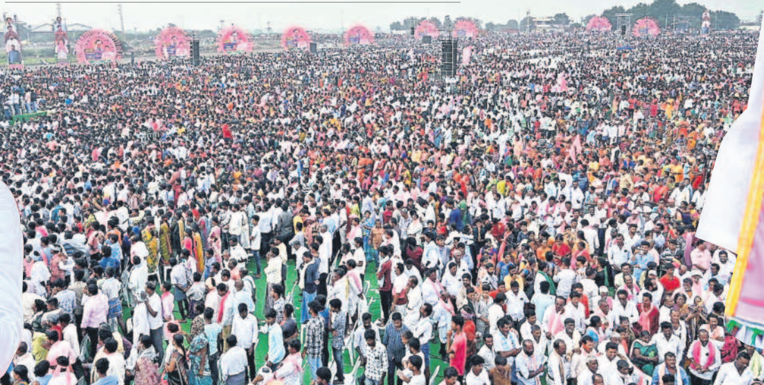
హాలియాలో సీఎం కేసీఆర్ బహిరంగ సభకు పెద్ద ఎత్తున హాజరైన జనం

80వేల మెజార్టీతో గెలిపించాలి | ఏడెనిమిది నెలల్లో నెల్లికల్లు లిఫ్ట్ పూర్తి