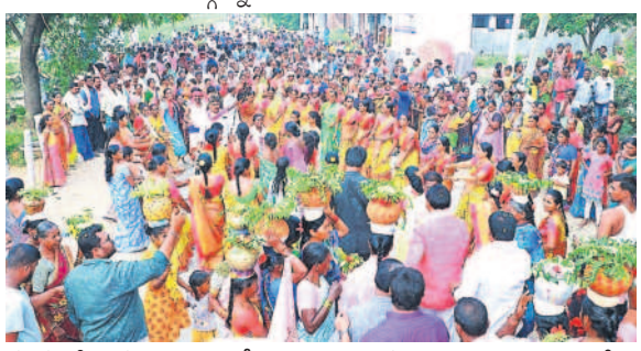
మునుగోడు మండలం చొల్లెడు, చందూరు మండలం కొండాపురంలో ఎమ్మెల్యే ప్రచారానికి పెద్ద ఎత్తున హాజరైన ప్రజలు