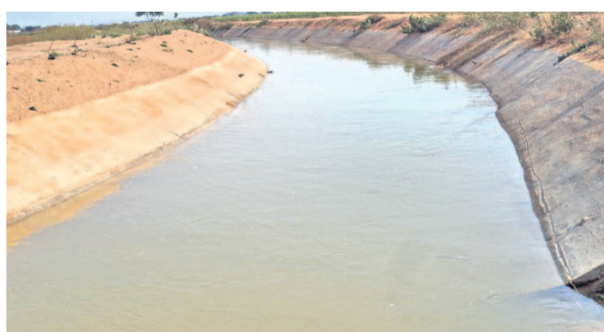
బోధన్ లోని నిజాంసాగర్ కాల్వల ఆధునికీకరణతో డి.28 కాల్వలో సాగునీరు ఉద్భవించి ప్రజాహింసను దృశ్యం