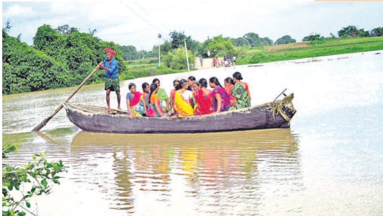
సానుభూతి... వానకాలం వద్ద ఏటా వచ్చే గ్రామాలకు ప్రజా ప్రతినిధులు వరదలా వచ్చేవారు. గోదావరి పోటెత్తినప్పుడు రోడ్డు మీది నీళ్లలో పడవ ప్రయాణం చేసే అక్కడి ప్రజలకు కనీసం తెచ్చేలా కూడా అది పనికొచ్చేది. ములుగు జిల్లా రామన్నగూడెం-రాంనగర్ మధ్యలోని జీడివారు వానకాలంలో ఉప్పాంగి ప్రవహించేది. దీంతో రాంనగర్, లంబాడితండా గ్రామాలకు వూళ్లూ రాకపోకలు నిలిచి పోయేవి. వంతెన కట్టాల్సిన చోట బోటు ఏర్పాటు చేసి చేతులు దులుపుకున్నారప్పటి పాలకులు.