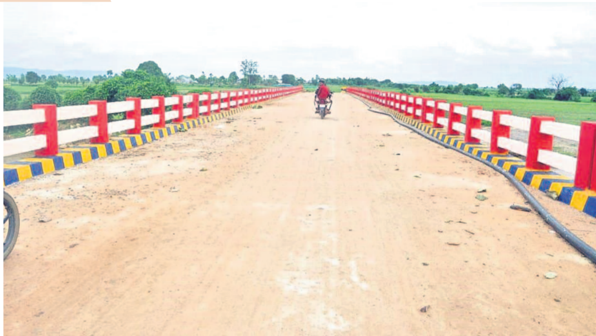
తెలంగాణలో ప్రజలకు అవసరమన్న ప్రతివేటా వంతెనల నిర్మాణానికి ప్రభుత్వం శ్రీకారం చుట్టింది. వాగును దాటలేక వైద్య సదుపాయాలు అందని దుస్థితిలో ఏ గ్రామమూ ఉండకూడదనేది సీఎం సుకల్పం. అందుకే జీడివారు మీద రూ.4.5కోట్లతో హైలెవెల్ బ్రిడ్జిని కట్టించారు. 80 మీటర్ల పొడవుండే దీనికి ఇరువైపులా కాంట్రీబోల్డర్, అప్రోచ్ రోడ్లను వెదకారు. ఇప్పుడు ఇక్కడి గ్రామాల నుంచి వసతికయ్యా, బడికియినా పదిలంగా పోతున్నారని జనం.