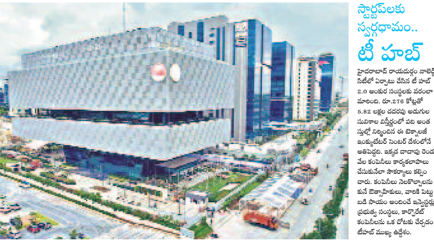
స్టార్లవలకు స్వర్గధామం.. టీ హబ్