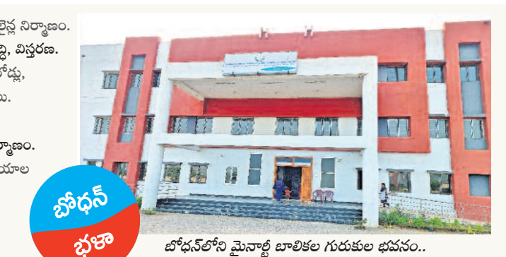
బోధన్ లోని మైనార్టీ బాలికల గురుకుల భవనం..