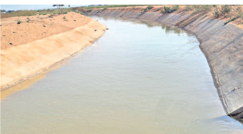
బోధన్ లోని నిజాంసాగర్ కాల్వల ఆధునికీకరణతో డి.28 కాల్వలో సాగునీరు ఉద్భవించి ప్రజాహింసను దృశ్యం