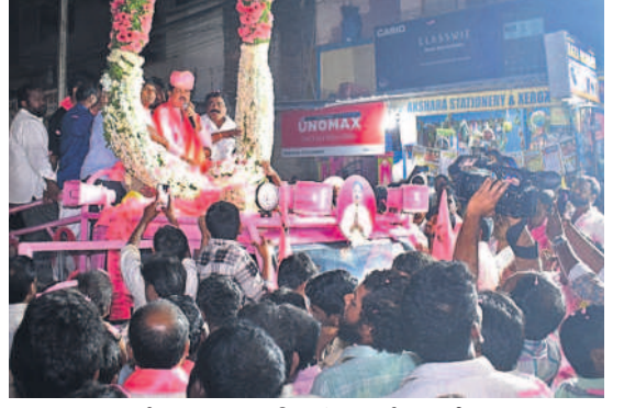
మూసాపేటలో బుధవారం జరిగిన రోడ్ షోలో ఎమ్మెల్యే కృష్ణారావుకు గజమాలతో స్వాగతం పలుకుతున్న కార్యకర్తలు