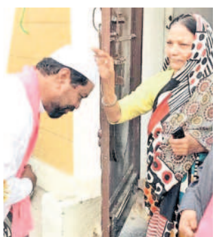
బాక్రీని ఆశీర్వదిస్తున్న ఓటరు