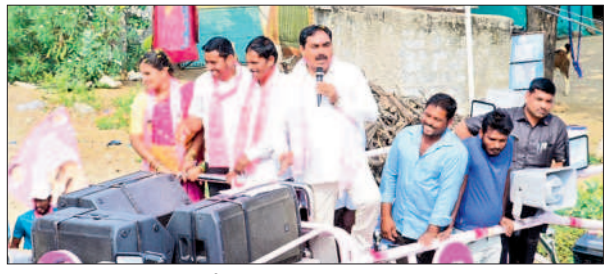
కంబాలకుంట తండాలో మాట్లాడుతున్న మంత్రి ఎర్రబెల్లి దయాకర్ రావు