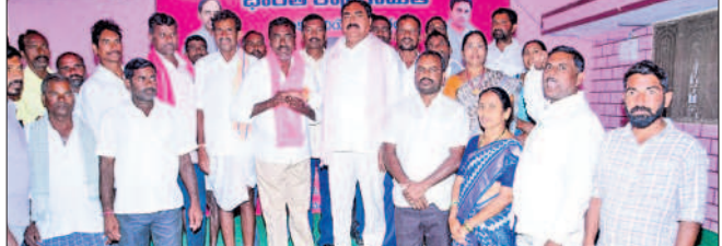
రాయపర్తి : పార్టీలో చేరిన మహబూబ్ నగర్ గ్రామస్తులతో మంత్రి ఎర్రబెల్లి