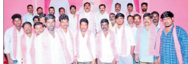
రాయపర్తి : పార్టీలో చేరిన కొలన్ పల్లి యువకులతో మంత్రి ఎర్రబెల్లి

పాలకుర్తి మండల కేంద్రానికి బీఆర్ఎస్ నాయకుడు