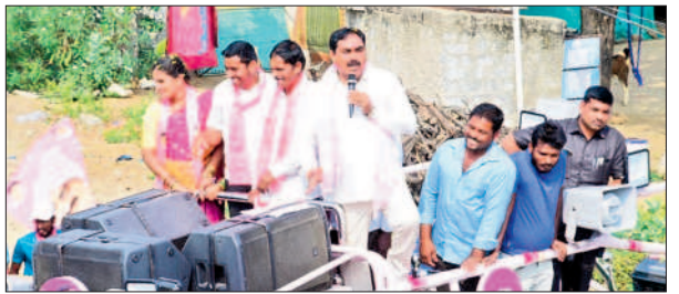
కంబాలకుంట తండాలో మాట్లాడుతున్న మంత్రి ఎర్రబెల్లి దయాకర్ రావు