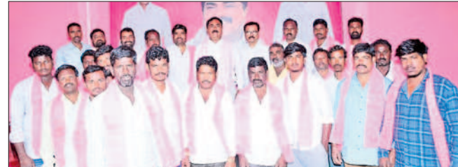
రాయపర్తి : పార్టీలో చేరిన కొలన్ పల్లి యువకులతో మంత్రి ఎర్రబెల్లి

పాలకుర్తి మండల కేంద్రానికి బీఆర్ఎస్ నాయకుడు