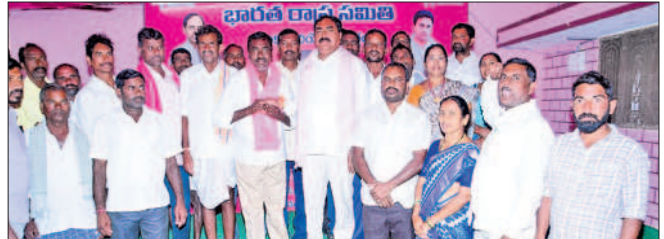
రాయపర్తి : పార్టీలో చేరిన మహబూబ్ నగర్ గ్రామస్థులతో మంత్రి ఎర్రబెల్లి