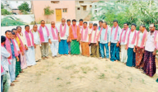
బీఆర్ఎస్కు మద్దతు తెలుపుతున్న వాల్మీకి సంఘం బోయ యువకులు, రైతులు