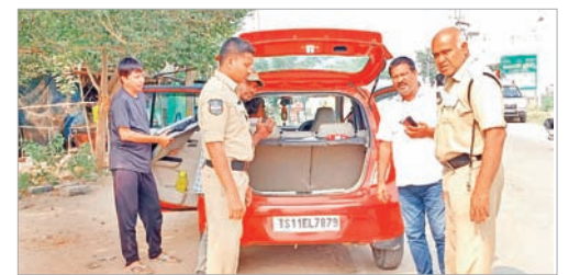
బొంకూరులో వాహనాలను తనిఖీ చేస్తున్న ఫ్లయింగ్ స్క్వాడ్ అధికారులు