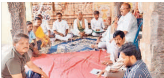
వేలంపాటలో పాల్గొన్న ఆలయ సిబ్బంది, భక్తులు