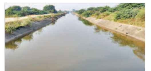
అర్థిఎస్ ప్రధానకాల్యాలలో పారుతున్న నీరు