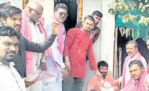
జైసూర్లో ప్రచారం చేస్తున్న బీఆర్ఎస్ నాయకులు