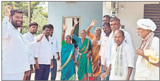
మానకొండూర్: పోచంపల్లి గ్రామంలో కారుగుర్తుకే ఓటు వేస్తామని చేతులెత్తిన నిందిస్తున్న వ్యక్తులు, ప్రజలు