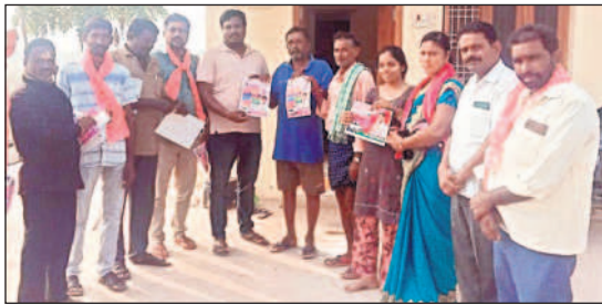
మానకొండూర్: కొండపల్లెలో ప్రభుత్వ సంక్షేమ పథకాలను వివరిస్తూ ఓటు అభ్యర్థిస్తున్న నాయకులు