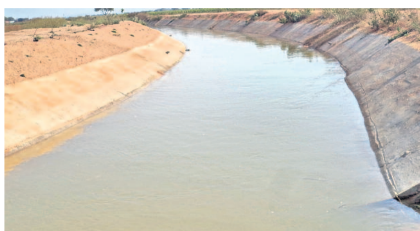
బోధన్ లోని నిజాంసాగర్ కాల్వలు ఆధునికీకరణతో డి.28 కాల్వలో సాగునీరు ఉద్భవంగా ప్రవహిస్తున్న దృశ్యం